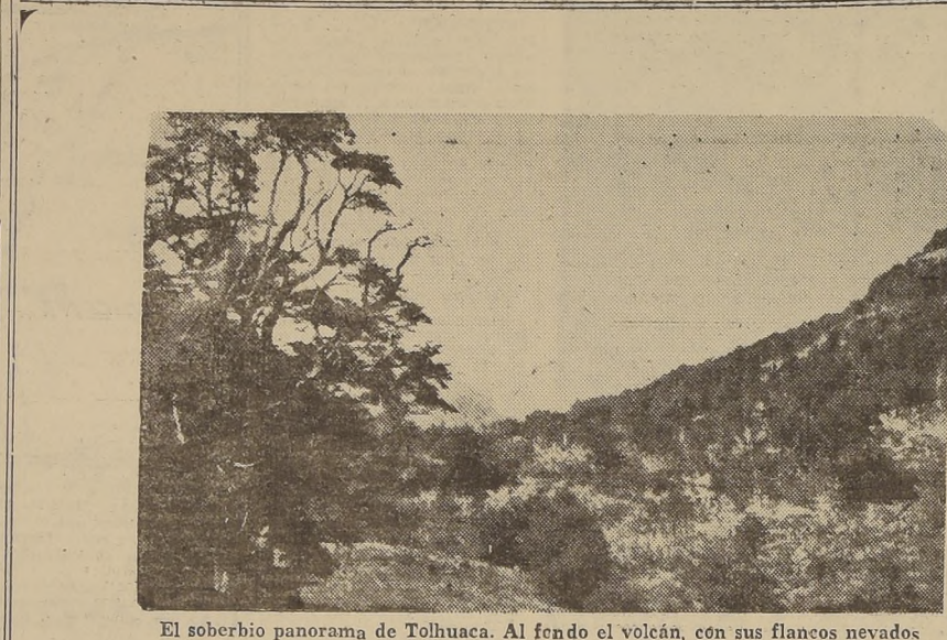
El soberbio panorama de Tolhuaca. Al fondo el volcán, con sus flancos nevados