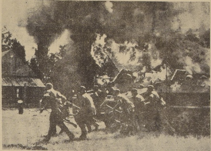
Los rusos siguen aplicando invariablemente la política de "tierra quemada" en todos los puntos del frente donde, debido a la presión alemana, se han visto obligados a repliegarse. Aquí vemos fuerzas de infantería alemanas al momento de llegar a una aldea que ha sido devastada por el fuego; avanzan cautelosamente esperando de ser atacados de un momento a otro

BERLIN, 19. (U. P.)— Se anuncia en forma autorizada que en el frente del este, particularmente en el extremo sur, las fuerzas alemanas están de nuevo "en movimiento". El Alto Comando informó hoy que se desarrollan con éxito nuevos ataques, pero no se especifica cuáles. Conspira además que en los combates librados los tres últimos días fueron tomados más de 10.000 prisioneros soviéticos y destruidos 171 tanques.