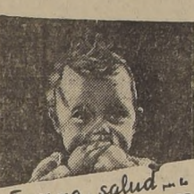
Fuerza, salud y felicidad. FOSFATINA FALIERES