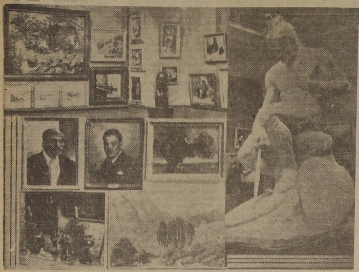
Parte de las obras que figuran en el Salón inaugurado hoy