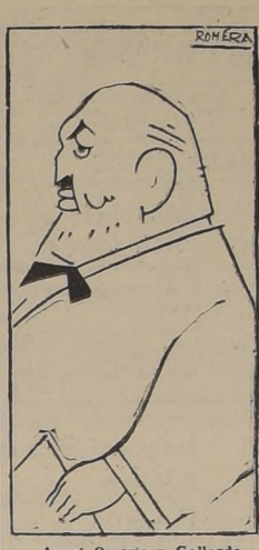
Angel Ossorio y Gallardo.

De nitida actualidad resulta el hermoso libro que con el título de "La España de mi vida" ha publicado, hace poco, el jurista español don Angel Ossorio y Gallardo.