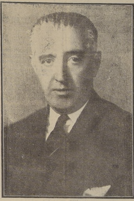
Don Juan Antonio Ríos