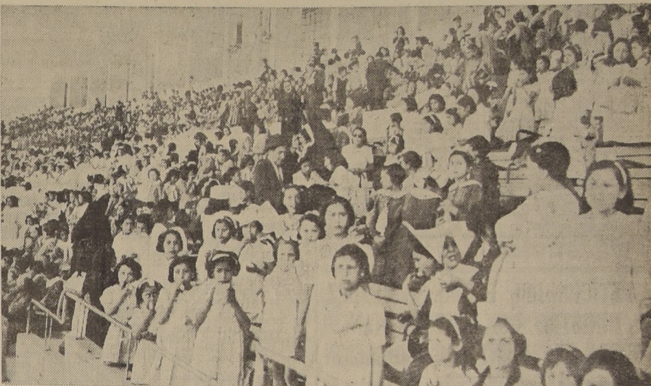
Un aspecto de las tribunas del Estadio Nacional, durante la fiesta anual de ayer, dedicada a los niños huérfanos de la capital

DESDE HACE 25 AÑOS SE EFECTUA ESTA FESTIVIDAD EJEMPLAR