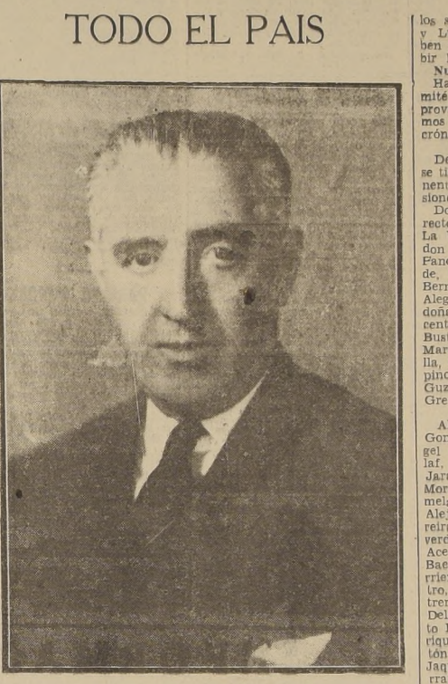
DON JUAN ANTONIO RIOS

Con toda actividad y entusiasmo continúa trabajando este Comité Nacional. Todos los días se reciben nuevas adhesiones y se reparte a las provincias la propaganda a favor de la candidatura. El Comité Ejecutivo, que como hemos indicado, se reúne todos los días de 12 a 13 horas, ha enviado a provincias por intermedio de los delegados que para este efecto se han designado, una interesante circular, en la que se reparte a las provincias la propaganda a favor de la candidatura.