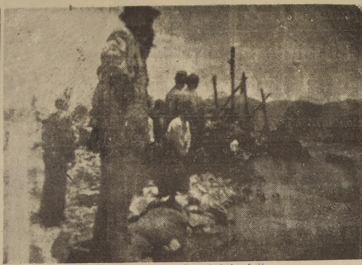
En plena labor de contener los efectos de la inundación.

En la mañana de ayer, el Gobierno recibió algunas comunicaciones telegráficas de las autoridades de La Calera, en las cuales se le informaba de que el río Aconcagua se había desbordado de su cauce, a consecuencia de una extraordinaria crecida provocada por los deshielos en la región cordillerana, causando numerosos perjuicios en una parte de dicho pueblo.