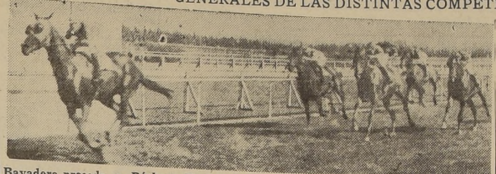
Bayadera precede a Bárbaro, Vuchan y Unamuno, en la competencia de la 6.a nota