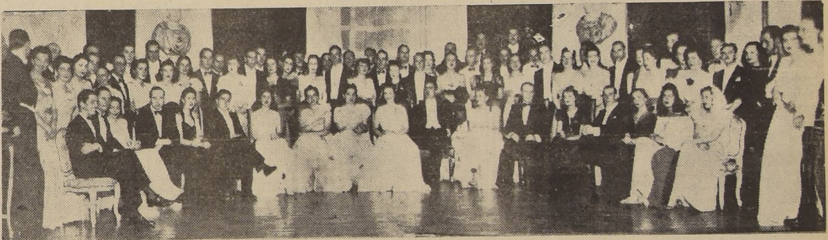
Asistentes a la comida ofrecida en honor de los hijos del Embajador de Colombia, en el Hotel Carrera.