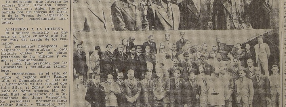
Arriba, los periodistas norteamericanos que nos visitan. - Abajo, los asistentes al almuerzo en Quebrada Verde

Muy festejados por sus colegas porteños han sido los miembros de la misión de representantes de diarios de EE. UU. - Cocktail ofrecido por el Cónsul Mr. Burt. - El programa de hoy