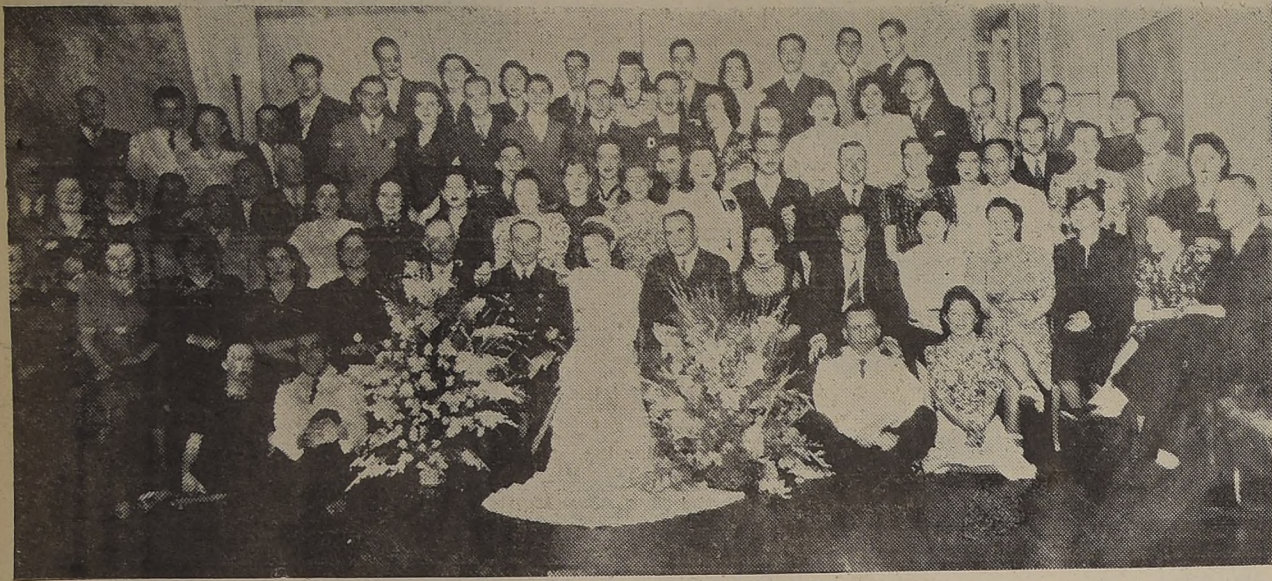
Matrimonio realizado últimamente en los salones del LUCERNA