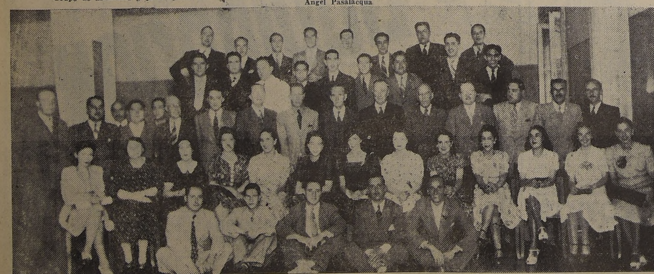
El personal de empleados de la firma Williamson Balfour y Cia. de Santiago, celebró el término del año con una magnífica fiesta en el salón de recepciones de la Confitería LUCERNA