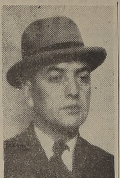
Manuel Montt Lehué