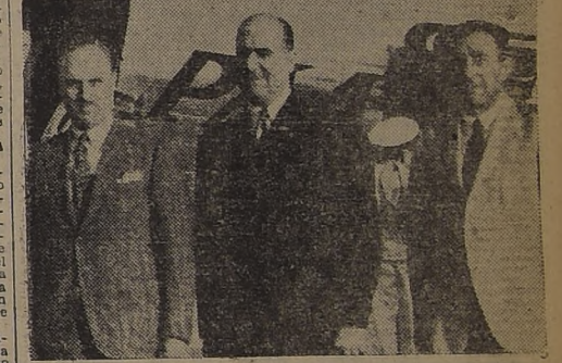
El Ministro de Hacienda del Perú y el asesor que lo acompaña, con el Ministro señor del Pedregal, a su llegada a Los Cerrillos

EN LOS CERRILLOS LE DIERON LA BIENVENIDA EL MINISTRO SEÑOR DEL PEDREGAL, EL EMBAJADOR PERUANO Y PERSONALIDADES