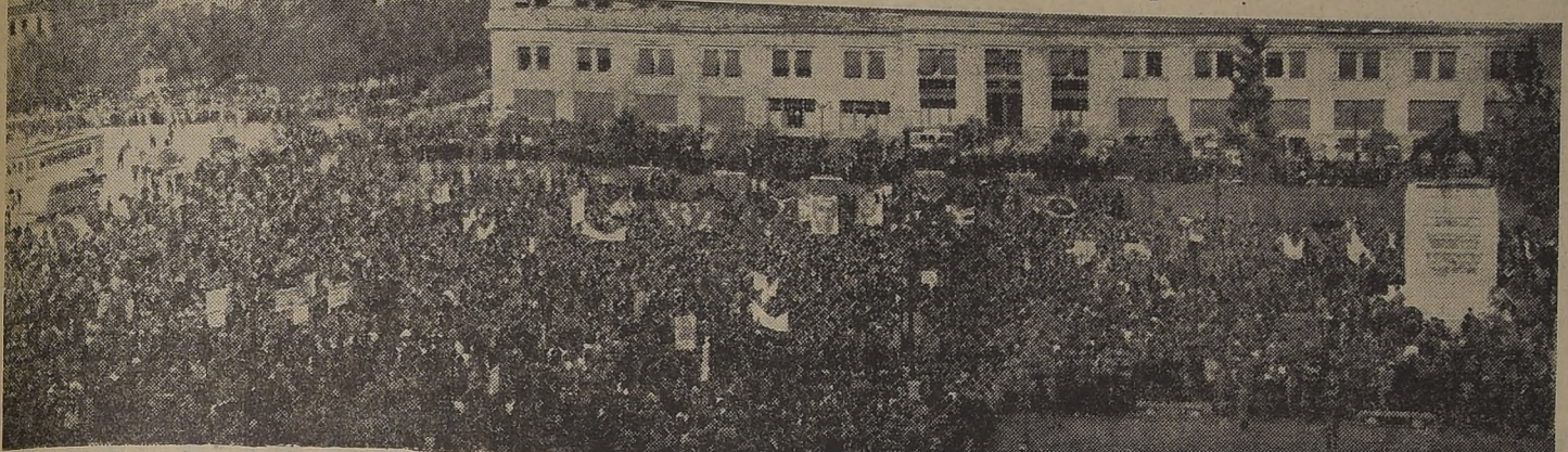
Parte de los asistentes al comicio de ayer en la Plaza Bulnes.

Dirigentes de los partidos de Izquierda y de la CTCH presidieron el comicio. — Los discursos. — Más de una hora duró el desfile con que terminó la grandiosa demostración popular contra las pretensiones presidenciales del ex dictador