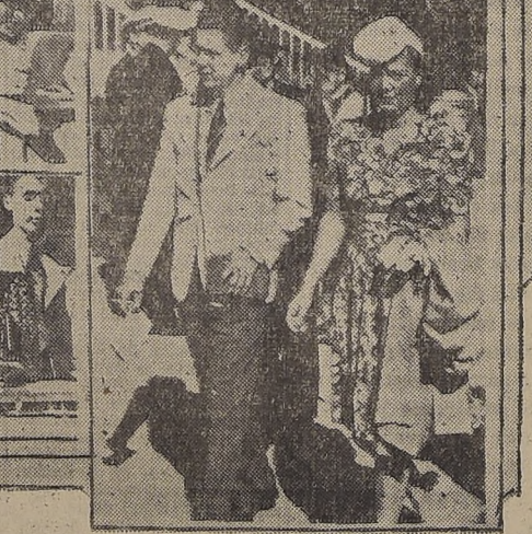
Con motivo de correrse ayer el "Derby" en las canchas del Valparaíso Sporting Club, de Viña del Mar, se dieron cita en ese recinto numerosas y distinguidas familias de la sociedad de Santiago, Valparaíso y Viña del Mar, algunas de las cuales aparecen en el presente grabado.