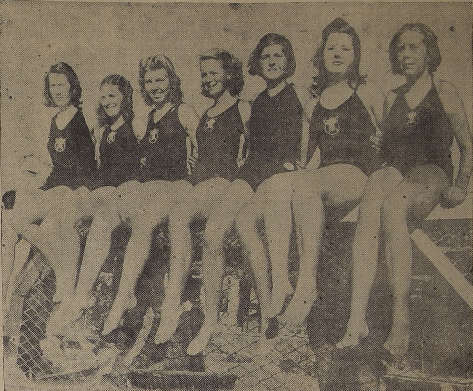
Equipo femenino del Prince of Wales.

En líneas generales podemos decir que en la competencia de Carabineros los clubes recogieron su primer premio en la forma que nos ha dado a conocer.