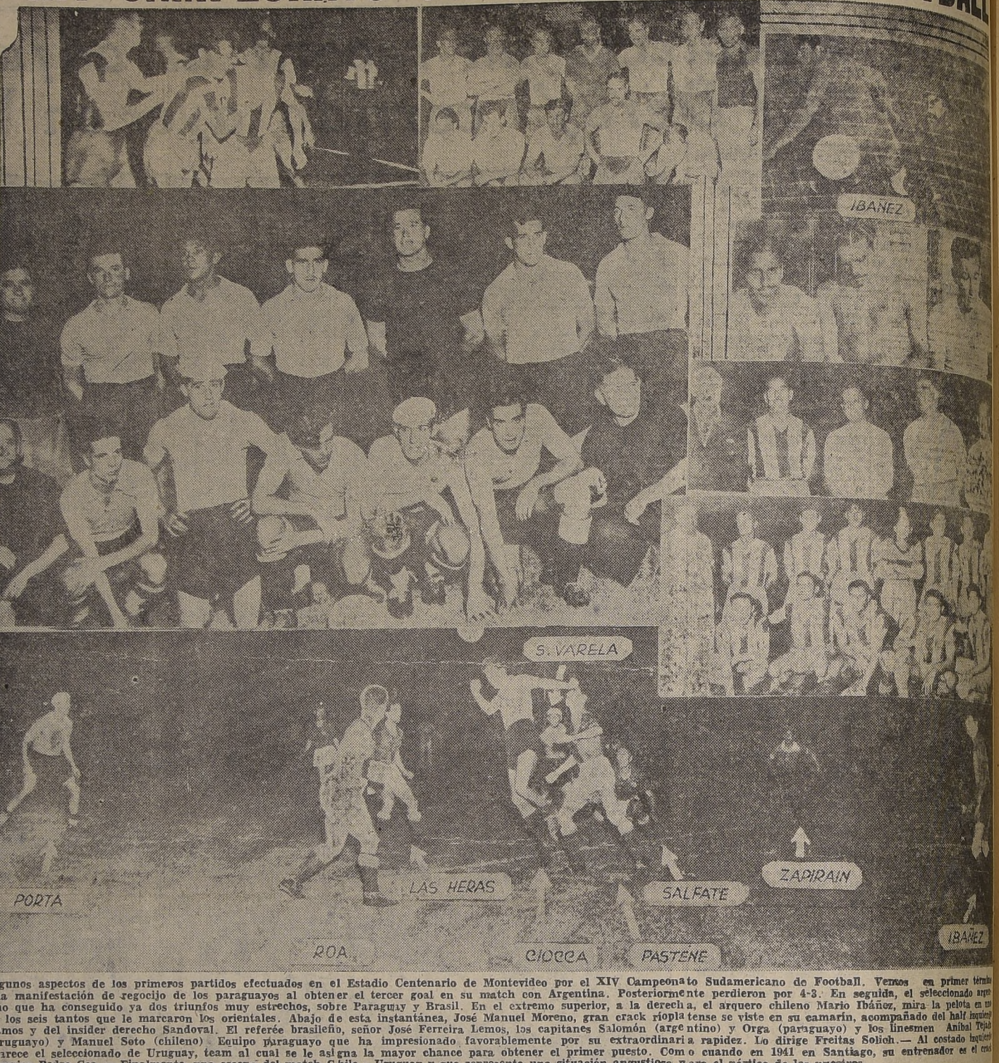
Algunos aspectos de los primeros partidos efectuados en el Estadio Centenario de Montevideo por el XIV Campeonato Sudamericano de Football. Vistos en primer término una manifestación de regocijo de los paraguayos al obtener el tercer goal en su match con Argentina. Posteriormente perdieron por 4-3. En seguida, el seleccionado argentino que fue surgiendo de los acontecimientos, pero siempre regido por cánones del fútbol, los chilenos aplicaron una táctica que conceptuamos perjudicial e inadaptable al fútbol, como es la marcación de hombre a hombre, sumamente trabajosa y de ningún resultado ante conjuntos de capacidad. Esto último quedó probado por los hechos ya al final de la primera etapa, cuando los chilenos continúan siendo aún elementos dotados de condiciones naturales e interesantes, pero que no han llegado a asimilar las enseñanzas que pudieron haber recibido.