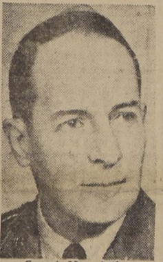
General Mac Arthur

Los japoneses emplearon esta vez la recia aguerida y selecta división conocida con el nombre de Tatori, pero ésta no tuvo mayor suerte que los intentos anteriores. La situación de acuerdo con lo que expresa el general MacArthur, continúa siendo buena.