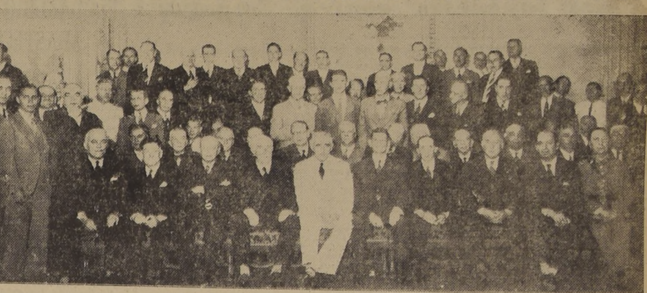
Asistentes a la manifestación ofrecida ayer tarde en el Club de la Unión por la Chile American Association a los periodistas norteamericanos...