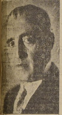
El Presidente electo, don Juan Antonio Ríos