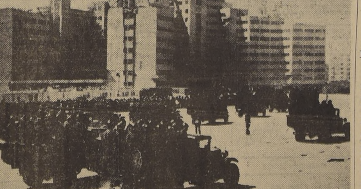
Plaza de Kharkov, uno de los principales objetivos rusos en Ucrania. Esta vista fué tomada días antes que esta plaza cayera en poder de los invasores