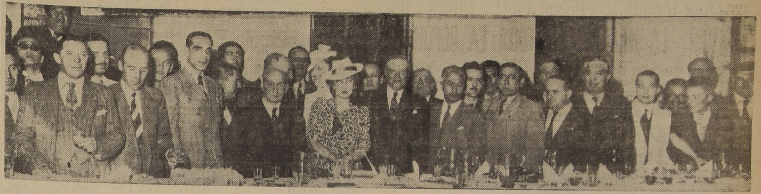
Una parte de los asistentes a la manifestación de ayer.

El Ministro de Relaciones les fué a esperar a Los Cerrillos. — Satisfechos de la Conferencia de Río de Janeiro