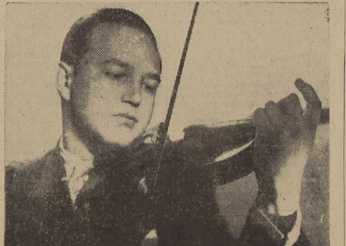
Ricardo Odnoposoff, violinista de fama mundial que actuará en el concierto de inauguración pasado mañana en Viña del Mar...