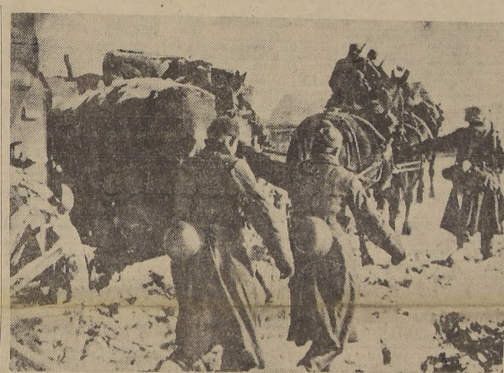
Tropas alemanas en su retirada en el frente ruso

Dnepropetrovsk se encuentra ya a menos de 30 kilómetros de las avanzadas rusas