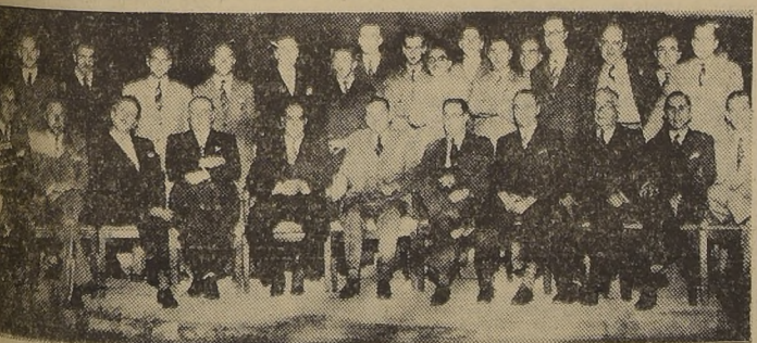
Asistentes a la comida ofrecida anoche en el Roof Garden del Hotel Carrera por el personal de la Cámara de Diputados en honor del Ministro del Interior don Alfredo Rosende y del presidente de la Cámara de Diputados don Pedro Castelblanco.