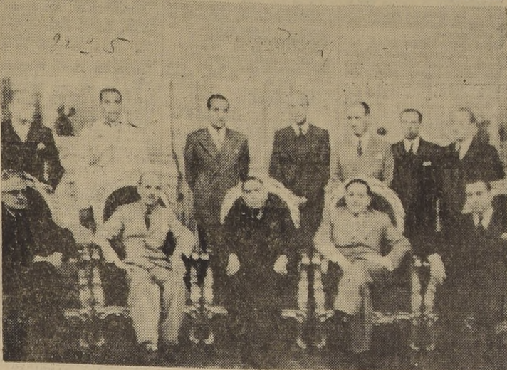
Durante la visita del Canciller peruano señor Soló y Muro al Excmo. señor Méndez

Solf y Muro y los miembros de la delegación del país hermano a la Conferencia de Río de Janeiro, partirán en la mañana de hoy por la vía aérea, en viaje de regreso a su patria.