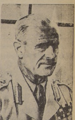
General A. Wavell, comandante en jefe de las fuerzas aliadas en el Lejano Oriente.

SINGAPUR, 5. — (U. P.) — Los grandes cañones de las fuerzas defensivas de Singapur arrojaron un fuego mortífero contra las concentraciones de soldados y columnas de refuerzos niponas que se hallaban en un terreno cretoso a la región meridional del Estado de Johore, causando descalabros entre ellas.