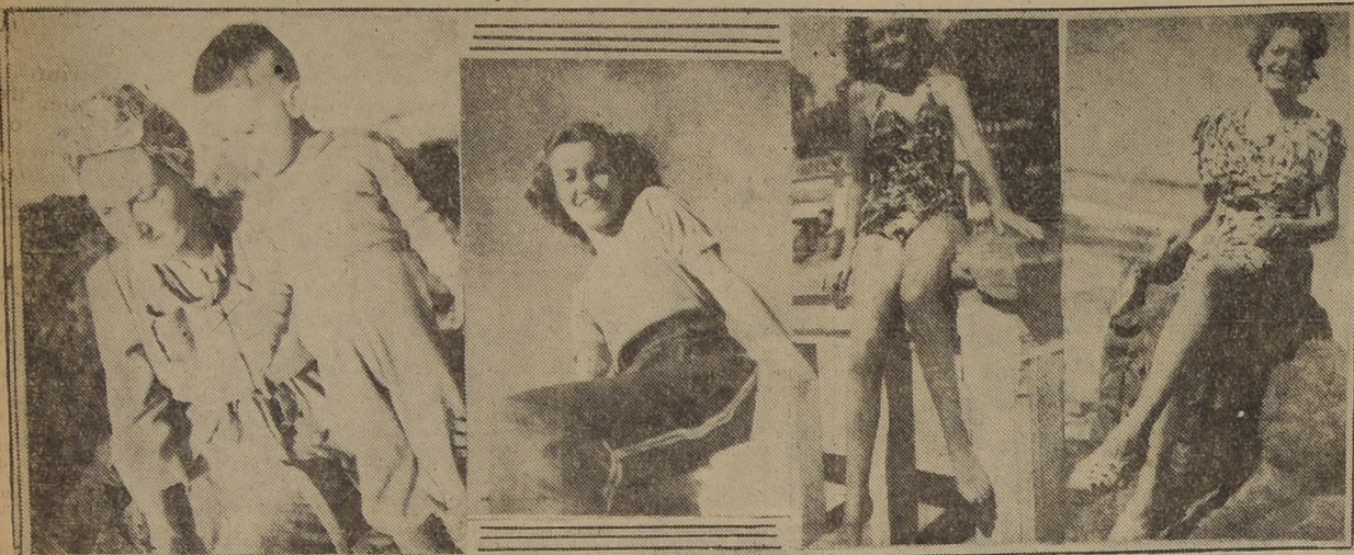
Hermosas damas que disfrutaban del veraneo en las playas de Cartagena