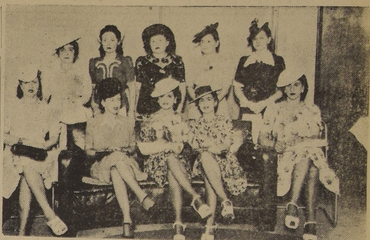
Grupo de alumnas de los Cursos de Verano reunidas en el LUCERNA al término de dichos cursos