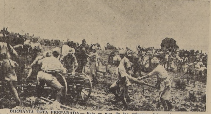
BIRMANIA ESTÁ PREPARADA. — Esta es una de las primeras fotografías oficiales de los vehículos con ruedas son muy poco prácticos en terrenos como estos, por lo que el transporte de los materiales debe hacerse a lomo de mula.

BATAVIA, 5 (U. P.) — Una vez más poderosas formaciones de aviones de bombardeo japoneses, fuertemente escoltados por aparatos de caza, atacaron con gran intensidad a la base naval aliada de Surabaya. La incursión comenzó a las 9.30 a. m. y aún proseguía a las 11 de la mañana.