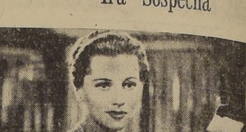
El idilio que se entretiene entre un fascinador aventurero y una mujer que le ama más que su propia vida, constituye la base sobre la que se desarrolla el asunto de "SOSPECHA" (Suspensión), la nueva película profesionalizada por JOAN FONTALNE y GARY GRANT que comenaremos el Martes en el Cervantes.

Trascurriendo en Inglaterra en la época inmediatamente anterior a la segunda Guerra Mundial, su argumento se refiere a la vida de Johnnie Aversparrh y Lina McLaughlin. Lina, sencilla pero fuerte y cariñosa, sucumbió al ser apasionadamente cortejada por Johnnie y se fue con él, entendiéndose demasiado tarde de que es un irresponsable que no tiene un solo centavo.