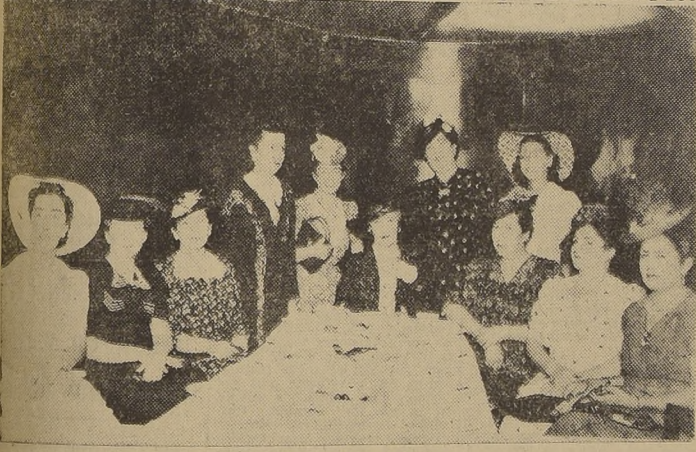
Despedida de soltera en el LUCERNA