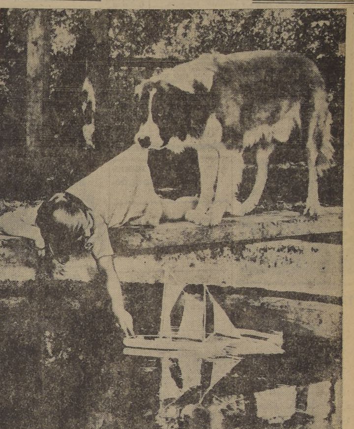
Esta simpática fotografía fué tomada en uno de los hermosos parques de la ciudad de Los Angeles, California. El gran perro San Bernardo, que figura como protagonista, está especialmente adiestrado para trabajar en los estudios de Hollywood.