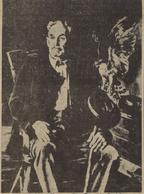
El montañés.—Oleo.— Por Eugenio Speicher