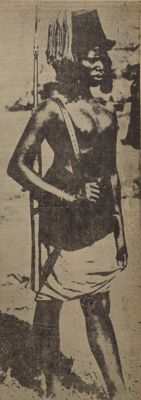
Las indígenas del Congo Belga, en el Africa, son famosas por su alta estatura y vigor. Son aficionadas a la caza e incluso, temibles guerreras.