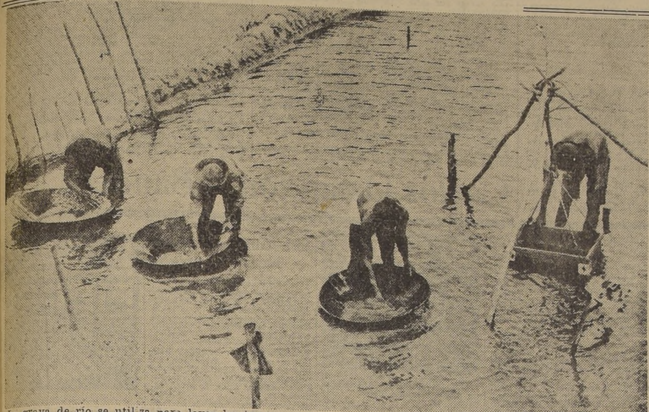
La grava de río se utiliza para lavar las impurezas y separar los diamantes industriales. El Brasil es uno de los principales productores de estos cristales que son importantísimos en la técnica industrial moderna. Son insubstituíbles para labrar a máquina ciertas clases de metales.