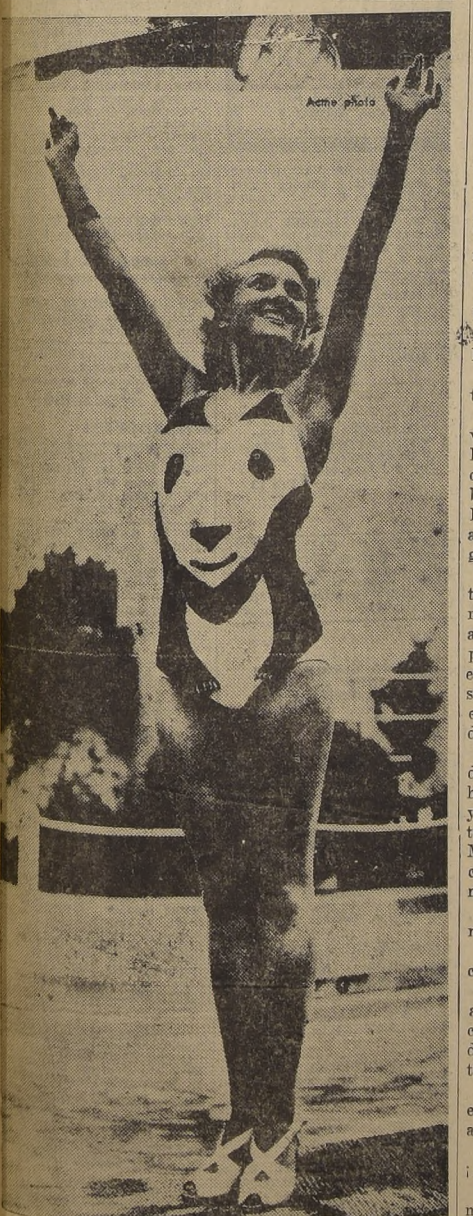
En un concurso celebrado en el elegante balneario de Miami Beach, llamó justamente la atención esta linda bañista con su original traje de baño, hecho de la costosa piel de un panda.