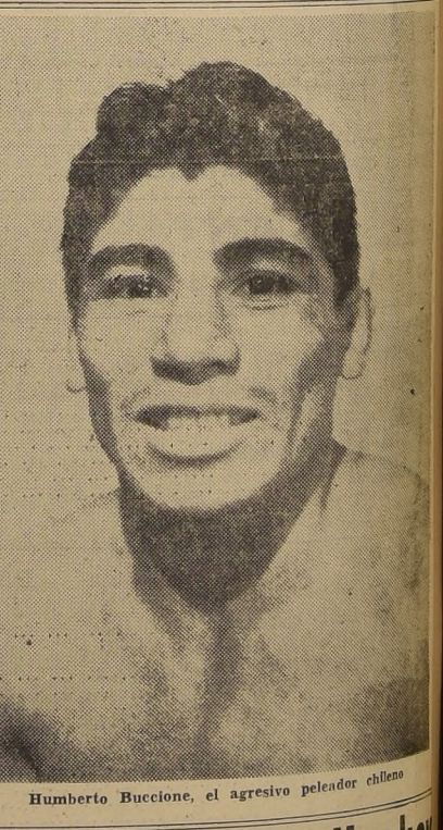
Humberto Buccione, el agresivo peleador chileno