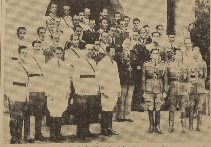
Parte de los asistentes al cocktail ofrecido a las delegaciones extranjeras en el Regimiento de Coraceros

Con el arribo de la oficialidad brasileña se completan los equipos que participarán en el concurso que se iniciará el día 21 del actual