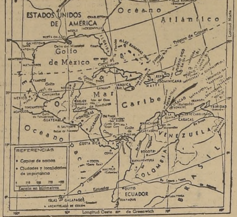
La flecha indica la isla holandesa de Aruba, en donde se encuentran las refinerías de petróleo más importantes del hemisferio occidental. Esos establecimientos han sido cañoneados por submarinos, que, a la vez, torpedearon a varios buques estancos.

W. CHURCHILL CEDERIA AL CLAMOR POPULAR QUE PIDE FORMACION DE UN GABINETE DE GUERRA REDUCIDO (Correspondencia de Ned Russell, exclusiva para LA NACION)