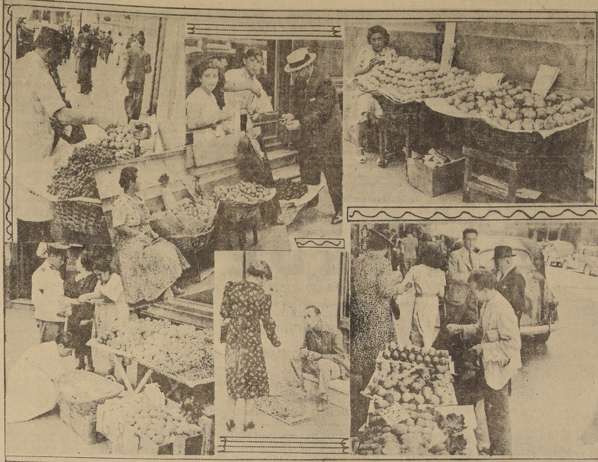
En todas las calles centrales de la capital, y especialmente en las mañanas, pueden observarse estos aspectos. A la venta de frutas, se dedican infinidad de personas, hombres y mujeres

¿ES NECESARIO ESTABLECER PUESTOS REGULADORES? Creemos que sí. En otras épocas se establecieron con el concurso mancomunado de las au-