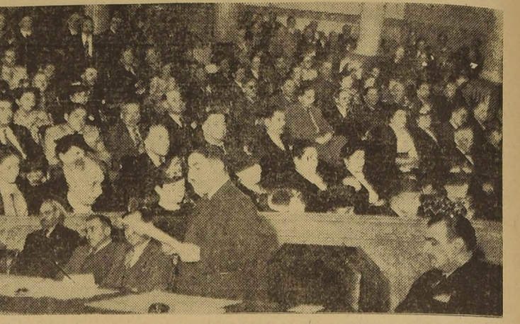
Parte de la concurrencia y la Mesa Directiva durante el acto inaugural de la Conv. Mutualista

El acto tuvo lugar en la Universidad, con asistencia de parlamentarios, dirigentes sociales y socios de instituciones locales.— Discursos del presidente y secretario general de la entidad organizadora