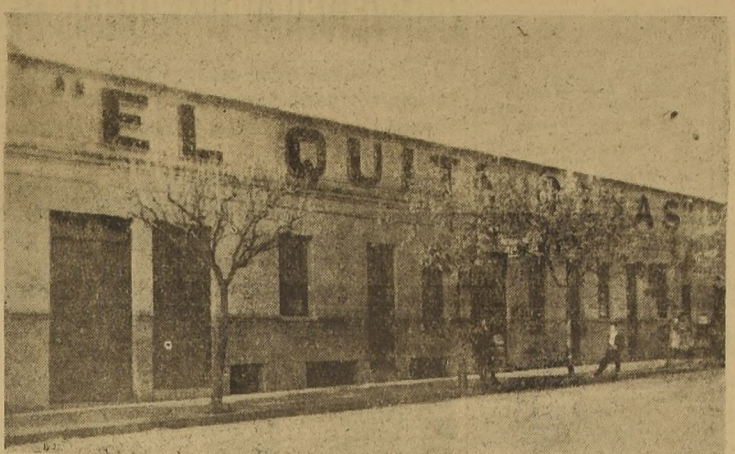
"El Quita Penas", famosa cantina de la calle Pantoeón

GERENCIA: EXPOSICION 1201 — TELEFONO 93452