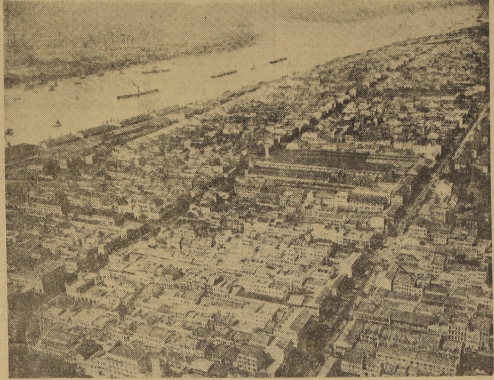
Vista aérea de Rangún. La capital de Mandalay, que acaba de ser abandonada por las autoridades civiles que han establecido la sede del Gobierno en Mandalay, cuenta con una población que se acerca al medio millón de habitantes y con un extenso barrio moderno que puede admirarse en el primer plano del grabado.