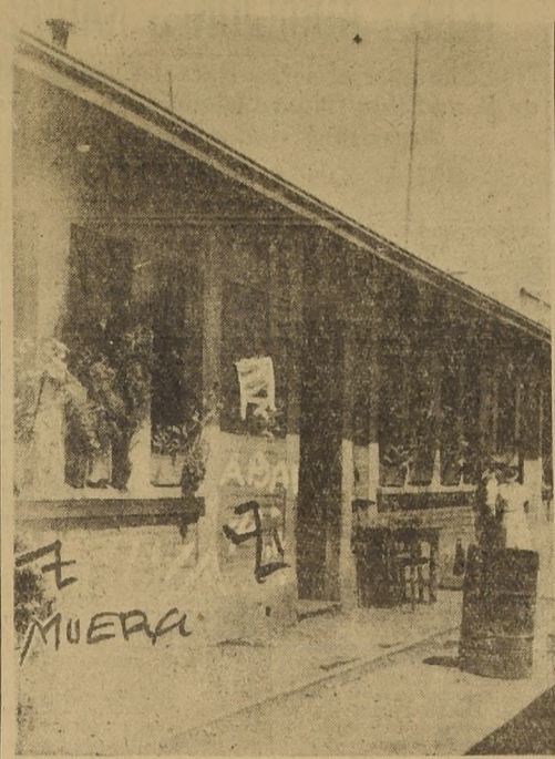
Un aspecto de la propaganda mural

Nadie sabe desde donde vino este costumbre. Es el caso que el cróllo tiene una historia, irrefrenable y gozosa inclinación por escribir en las murallas.