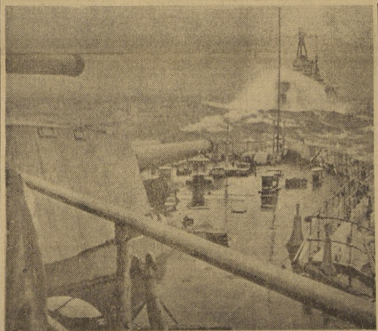
Acorazados franceses, navegando con mar gruesa.