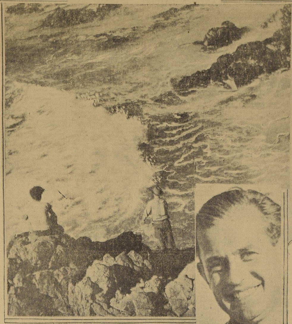
Nuestro paisaje, plácido de luz y de color, atrae todas las aspiraciones artísticas...