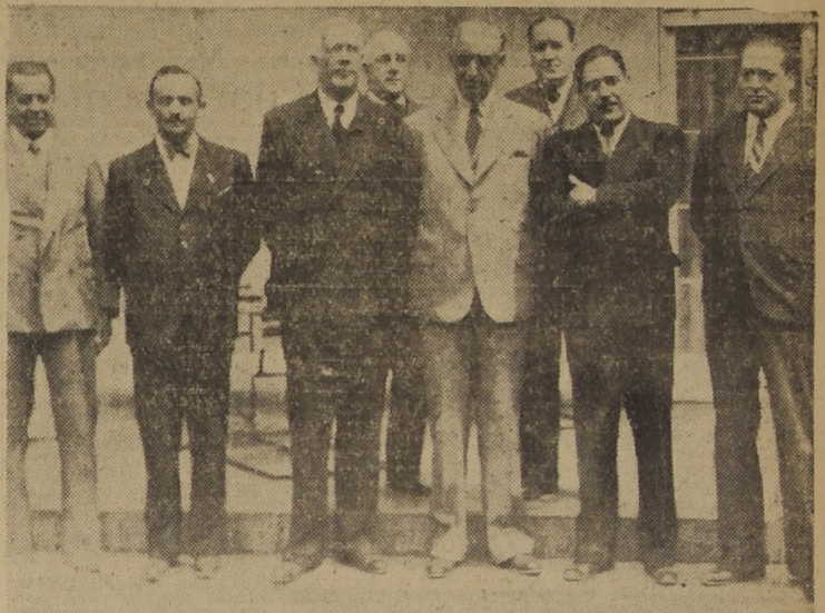
El Presidente Electo, don Juan Antonio Ríos, acompañado de los dirigentes de la Junta Provincial Radical, que lo visitaron ayer.