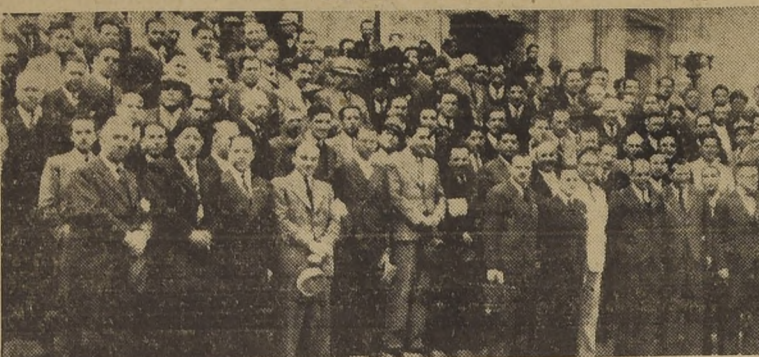
Grupo general de delegados asistentes al Congreso de Municipalidades