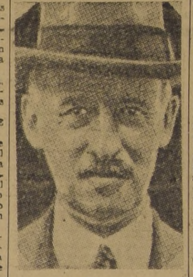
Henry L. Stimson