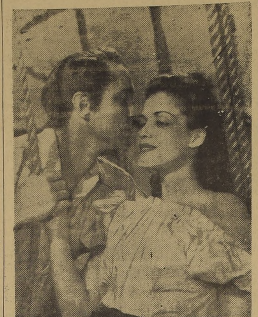
"Yo tomo esta mujer", tal es el título de la epopeya filmada en los Estudios Universal y que va desde mañana en Teatro Continental y cuyo principal intérprete es Franchot Tone.