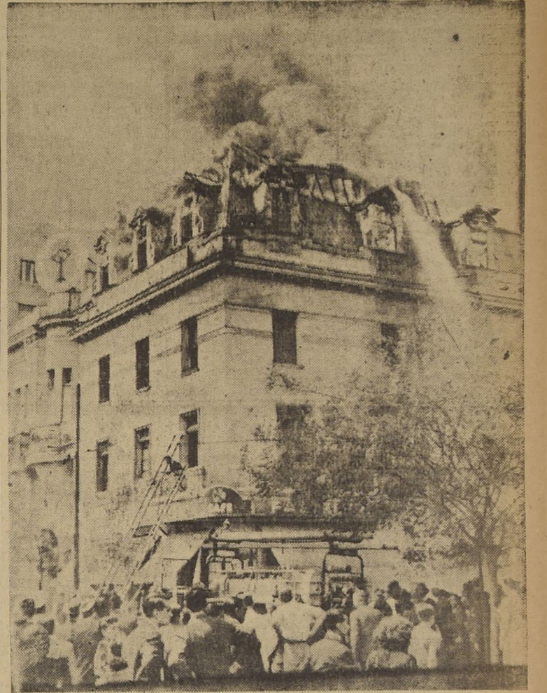
El cuarto piso del Hotel Windsor, en pieza a ser destruido por las llamas.

Los pensionistas del establecimiento perdieron en su mayor parte sus muebles y objetos. — Grave interrupción del tránsito. — Los negocios afectados por el agua y el fuego