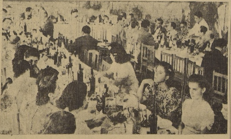
Parte de los asistentes a la manifestación de los Empleados de Correos

También se hizo extensivo este homenaje a la prensa de Santiago y de provincias. — Fue con motivo de la aprobación de la ley que les mejoró sus sueldos