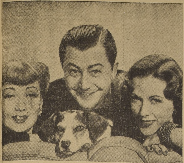
Eleanor Powell, Robert Young, Ann Sothern y un maravilloso perro, posan ante el fotógrafo al terminar la filmación de “No Estamos Casados”, producción de Metro-Goldwyn-Mayer realizada con todo el esplendor que se requiere para este género de comedias

El próximo viernes estrenará el Teatro Metro, de nuestra capital, una de las más lujosas producciones musicales filmada en los estudios Ziegfeld. Se titula esta nueva producción “No Estamos Casados”, y su título original en inglés de “Lady Be Good”, nos enseña el “leit-motiv” musical de ella, la famosa canción “Lady Be Good”. Protagonizan este film, Eleanor Powell, Robert Young, Ann Sothern y Lionel Barrymore. Este cuarteto de grandes figuras de la pantalla encabeza a su vez un reparto de artistas del baile, de la canción o de la comedia, que sobrepasa el número de 2.000 extras. Cabe destacar la actuación de “Los Hermanos Berry”, el trio de negros bailarines más populares de los E.E. UU.