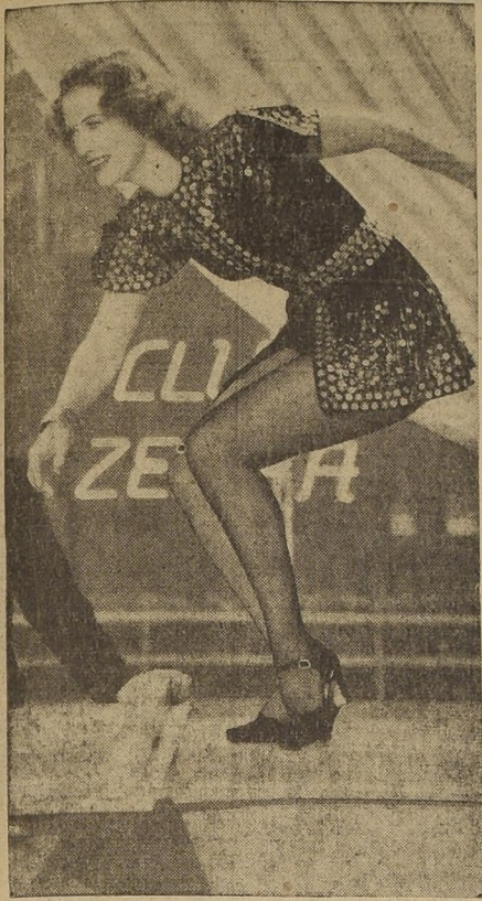
Eleanor Powell, principal figura de la gran producción Metro Goldwyn Mayer, titulada «No estamos casados» y cuyo estreno deberá adquirir los contornos de uno de los más grandes espectáculos de la presente temporada.

«Lady Be Good», vieja canción que embellece, inolvidables instantes, sirve de «leit-motiv» a la nueva producción Metro Goldwyn Mayer, «No estamos casados», una dinámica y atrevida historia musical que protagoniza la gran artista y notable ballarina Eleanor Powell, con Ann Sothern, Robert Young, John Carroll, Red Skelton y la famosa cantante Cara de Palo, Virginia O'Brien.