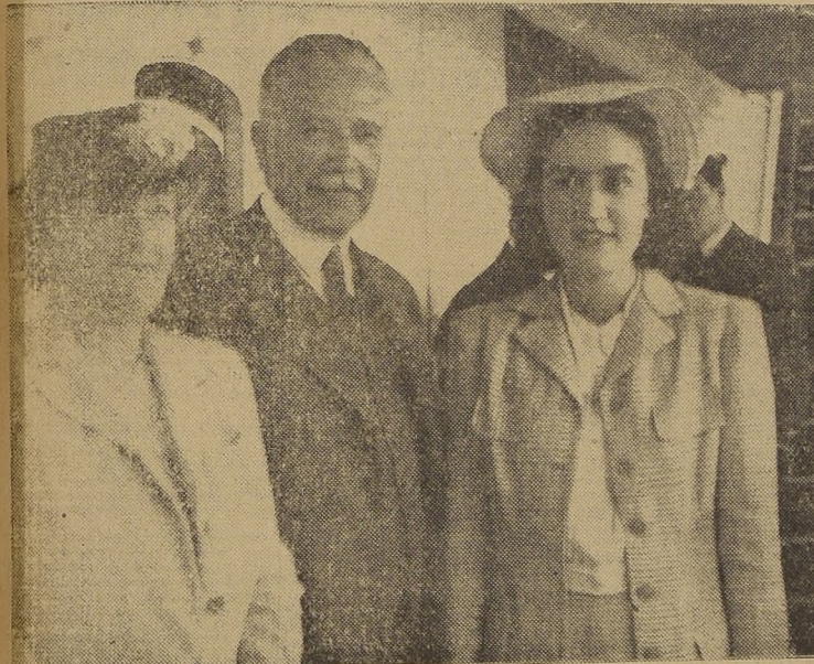
Distinguidos viajeros que arribaron a Valparaíso en la motonave Imperial, de la Cia. Sud Americana de Vapores: