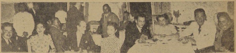
Algunos aspectos de los asistentes a las agradables reuniones del Roof Garden del Carrera.