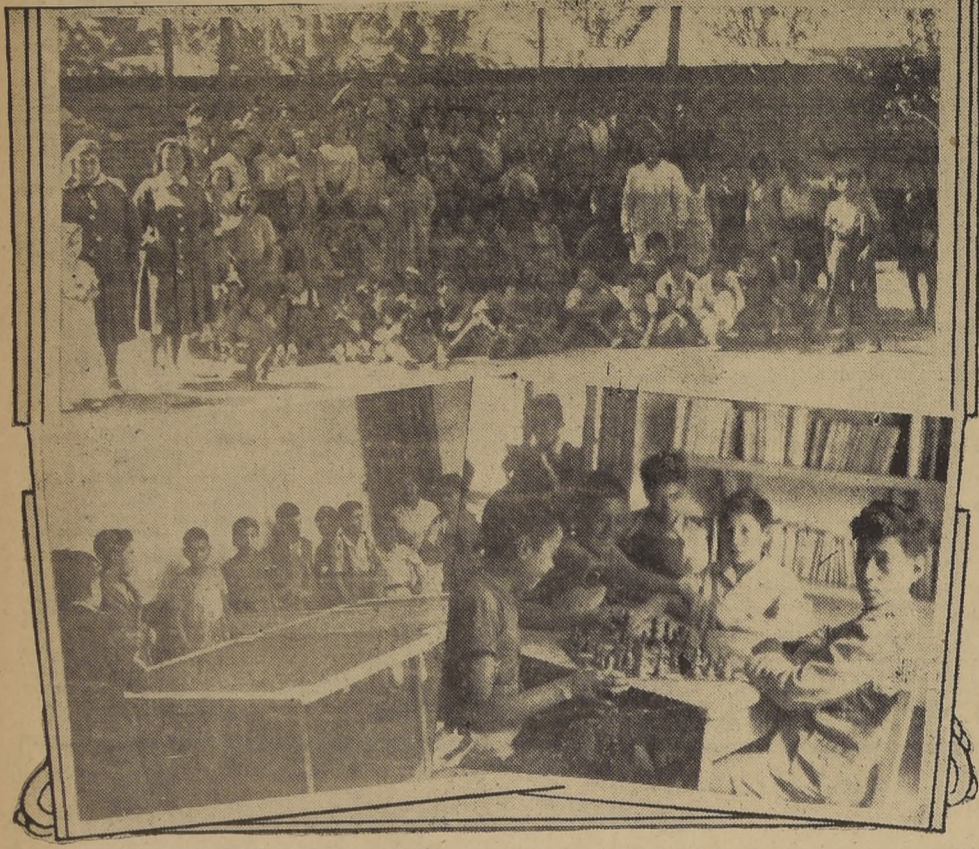
En el grabado aparece, en primer término, una parte de los niños que disfrutaron de los beneficios del Settlement. — Abajo, dos grupos de escolares durante sus horas de esparcimiento

Nos dicen varias personas que conocen a fondo la gran labor que desarrolla esta progresista organización.— El goce de esa propiedad emana de un acuerdo municipal y no de una orden alcaldía