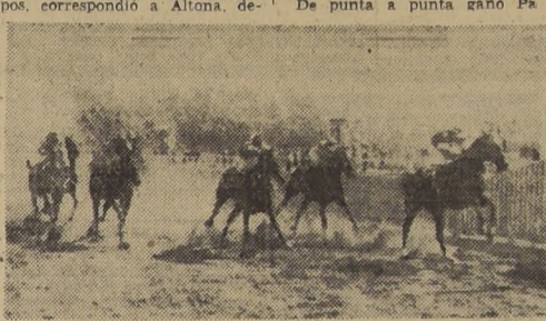
L'Eperon hace suya la prueba de clausura sobre Chevroline, Sex Appeal y Far Molto

que exhibían los 16 participantes entre los cuales hizo su favorito a Renaquito, que sólo pudo finalizar segundo, mientras el triunfo lo alcanzó Espiga que abonó $ 153,30 con cinco pesos.