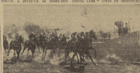
Paradojal la penúltima carrera, que correspondía a la segunda serie de los compromisos de velocidad.