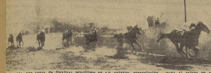
Quebranto, que venia de finalizar penúltimo en su anterior presentación, gana al galope en el compromiso de fondo, precediendo a Lozer, El Mariachi y Proeza

La ventaja que le llevaba Paradojal, pero éste anuló su ímpetu por cuerpo y medio.