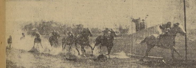
Paradojal, delante de Oleaje, Conan Doyle y Loncoll, en la penúltima

La ventaja que le llevaba Paradojal la penúltima carrera, que correspondía a la segunda serie de los compromisos de velocidad.