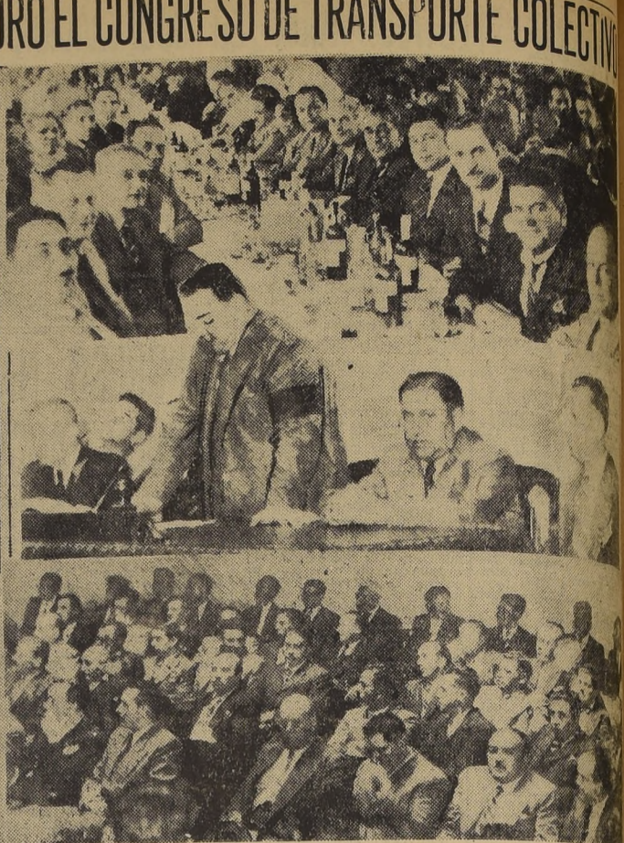
En el grabado aparece, en primer término, una parte de los asistentes al almuerzo en El Llano. En el centro, la mesa directiva del Congreso. Abajo, algunos de los concurrentes a la sesión inaugural.