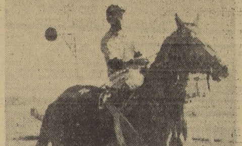
Espiga se impone en buen estilo sobre Renaquito, Lucrecia Borgia y Estratófiera, en los 950 metros del clásico "Santiago"