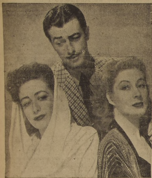
Como pez en el agua, Robert Taylor entre Joan Crawford y Greer Garson, tiene admirable ocasión de demostrar sus méritos de galán joven, en la nueva película «De Mujer a Mujer», que estrenará el próximo Viernes el Teatro Metro