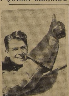
RONALD REAGAN, principal protagonista del film "Escuadrilla Internacional"

Ronald Reagan, principal protagonista del film "Escuadrilla Internacional" EL CONCURSO Acertar en este concurso no es ningún problema; sólo basta poseer algunos conocimientos de la historia de la aviación. Y si no se tienen, otra persona los tendrá y estamos seguros de que le responderá satisfactoriamente a lo que usted le presente, máxime si se trata de algo que va en beneficio de su propia cultura.