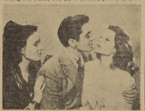
«...y empieza el drama: quiere a su mujer y también quiere a la otra...»

Una escena pasional de la extraordinaria producción, en tecnicolor, de la 20th Century Fox, que va el Martes próximo en el Real