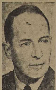
GENERAL MAC ARTHUR

WASHINGTON, 25.— (U. P.). El Presidente Roosevelt concedió al General Douglas Mac Arthur la medalla de honor del Congreso por valentía destacada e intrepidez superior a los dictados del deber.