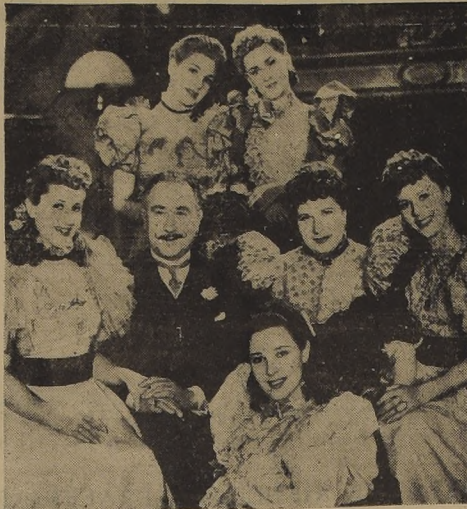
Una de las escenas de la producción argentina del sello EFA...