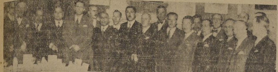
Asistentes a la manifestación ofrecida anoche en el Casino de la Escuela de Aviación.