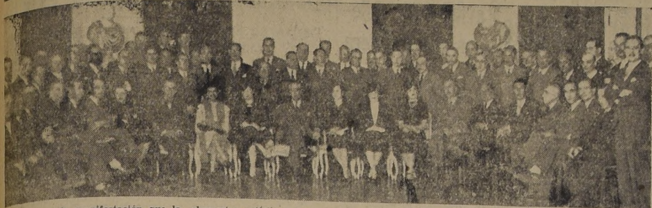
Asistentes a la manifestación que los elementos artísticos, teatrales y cinematográficos ofrecieron hoy a mediodía al Embajador de México, Excmo. señor Octavio Reyes Spindola, como una demostración de aprecio y reconocimiento por la labor desinteresada de difusión del arte y en beneficio de los artistas, que tan brillantemente ha realizado entre nosotros el ilustre diplomático.