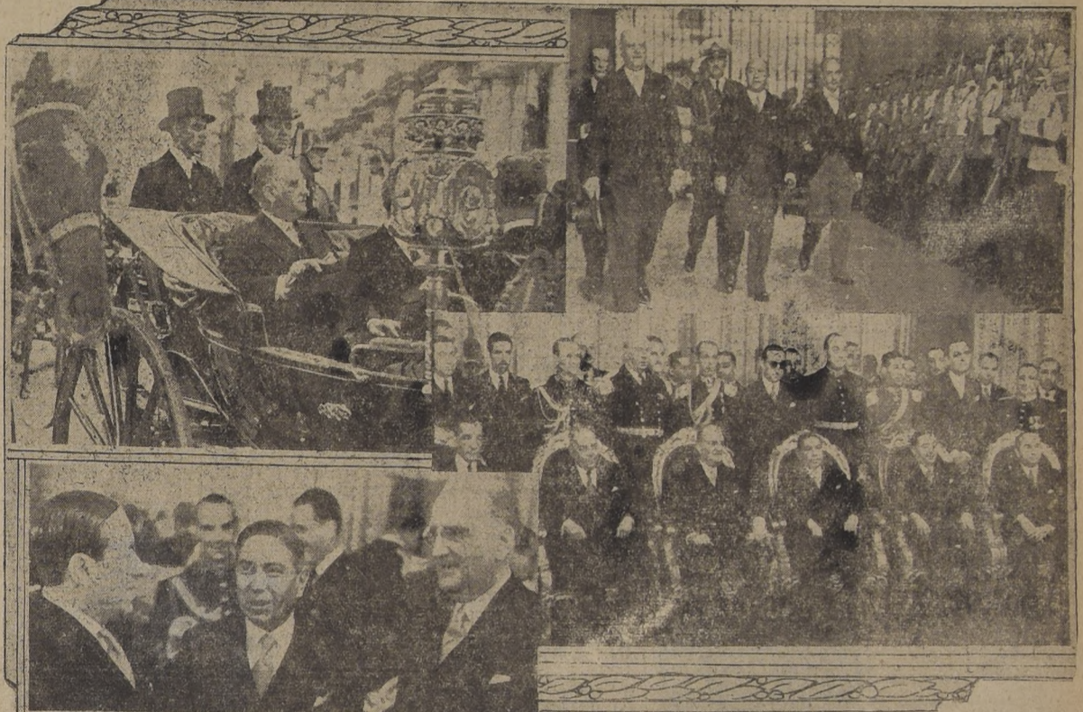
1.º El Canciller argentino llegando a La Moneda. — 2.º La guardia de Palacio le rinde los honores de ordenanza. — 3.º El Excmo. señor Ruiz Guíñazu conversa cordialmente con S. E. el Vicepresidente de la República y con el Canciller chileno. — 4.º El Excmo. señor Jerónimo Méndez, el Canciller argentino, el Canciller chileno, el Embajador de Argentina, el Ministro del Interior, miembros de la Embajada Extraordinaria de Argentina y funcionarios de la Cancillería.

EL EMBAJADOR ARGENTINO OFRECERA EL DOMINGO UNA RECEPCION