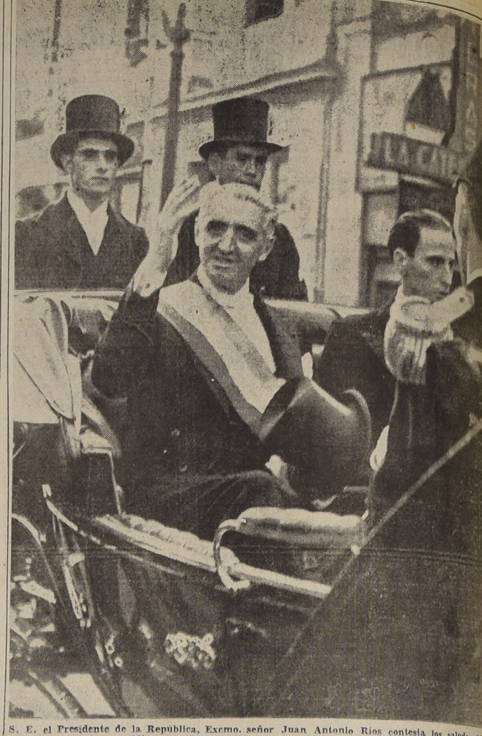
S. E. el Presidente de la República, Excmo. señor Juan Antonio Ríos contesta los saludos del público, que lo ovacionó durante todo el trayecto.

En la reunión que celebró anoche el Consejo Nacional de la Asociación de Funcionarios del Trabajo de Chile, se trataron diversas materias de importancia.