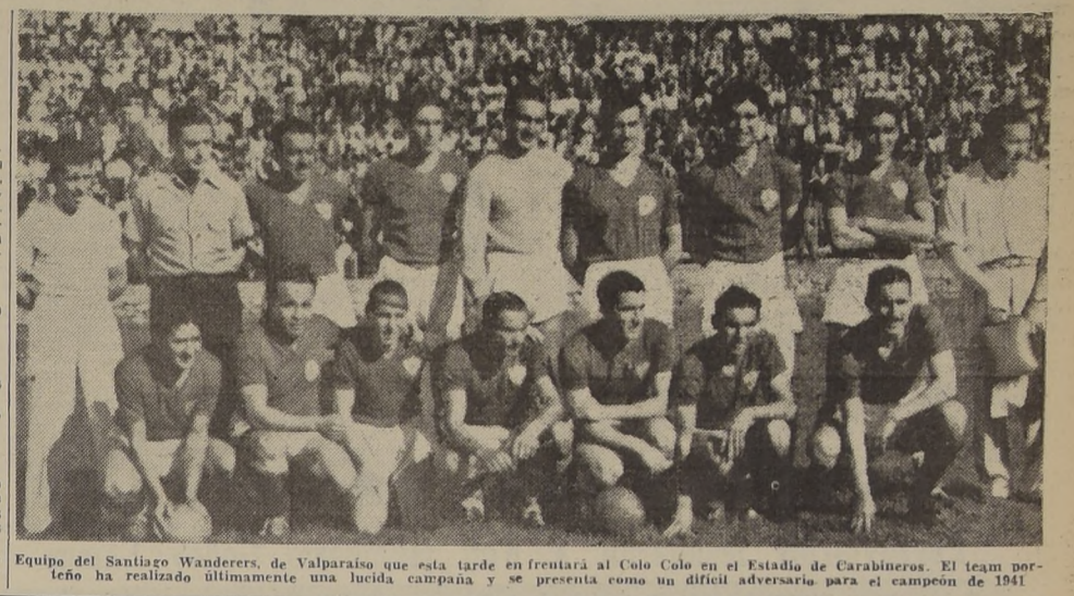
Equipo del Santiago Wanderers, de Valparaíso que esta tarde enfrentará al Colo Colo en el Estadio de Carabineros. El team porteo ha realizado últimamente una lucida campaña y se presenta como un difícil adversario para el campeón de 1941