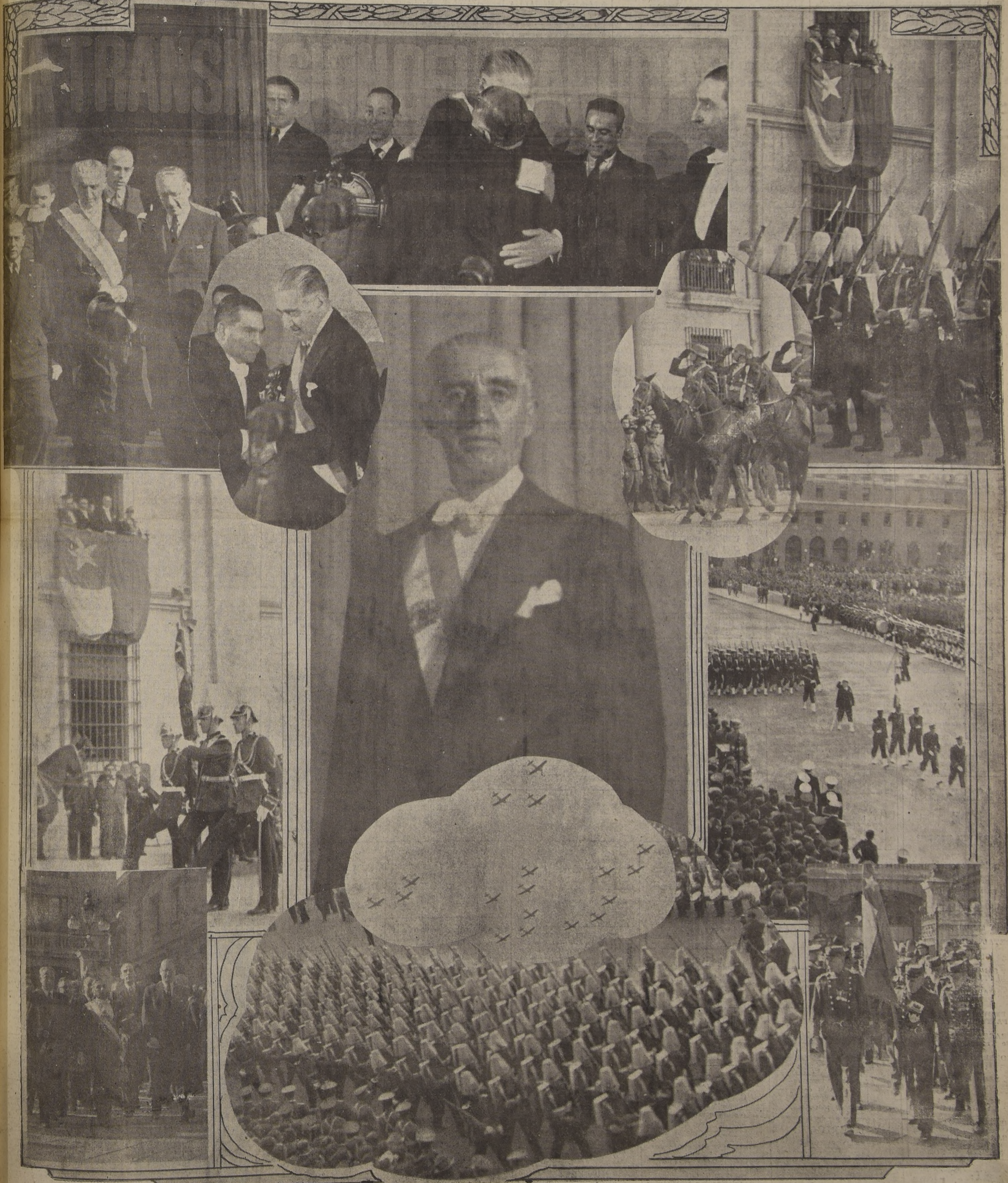
Al centro, el Excmo. señor Juan Antonio Ríos, que ayer asumió la Presidencia de la República.—Arriba, el Excmo. señor Jerónimo Méndez abraza al Excmo. señor Ríos; en seguida, la Escuela Militar desfilando ante S. E.—Más abajo, en el óvalo de la izquierda, el Presidente del Senado, don Florencio Durán, felicita al Excmo. señor Ríos.—Más abajo, a la izquierda, el abanderado de la Escuela Militar y su Escolta desfilan ante el Presidente de la República; a continuación, el Vicepresidente de la República, en los momentos que llega al Congreso Nacional.—Abajo, a la derecha, presentación de la Escuela Naval y de los Veteranos del 79.