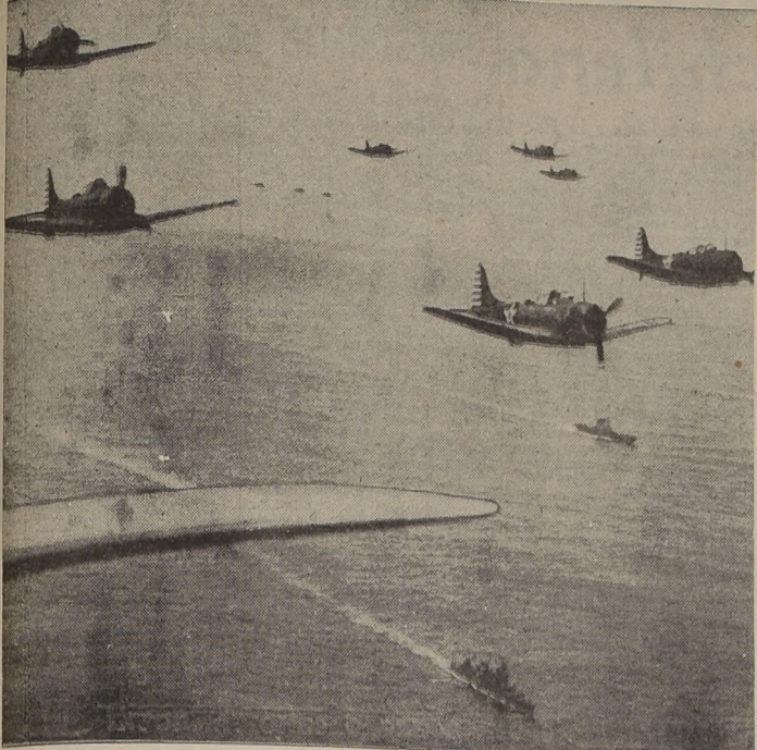
Unidades aéreas de la flota portuamericana explorando el Pacífico en busca del enemigo. Obsérvese el imperio de los bombarderos. Un grupo de unidades de esta clase causó grandes estragos entre las posiciones militares japonesas en las Islas Marshall y Gilbert...