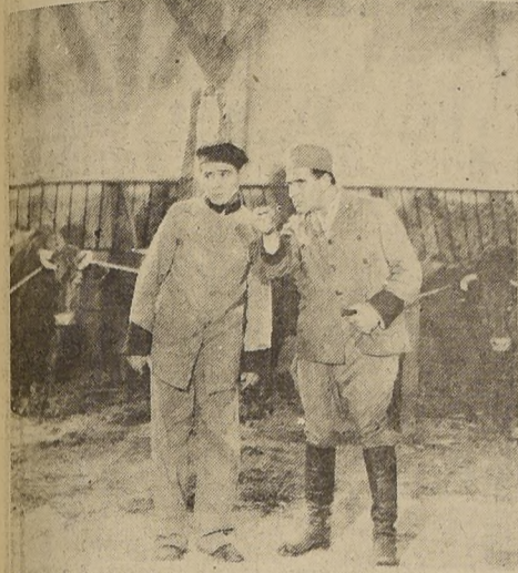
Una de las hilarantes escenas de "AMOR... AL TOQUE DE CLARÍN" del sello Argentina Sono Film...