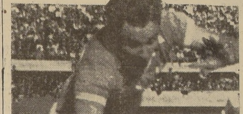
Sergio Livingstone, el arquerio internacional de la U. Católica, que atraviesa por su mejor período.