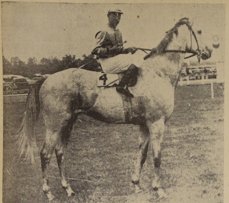
FILIBUSTERO, el notable torcido, crack indiscutible de nuestras pistas, ganador de más de un millón de pesos en premios, y que pasado mañana debe agregar un triunfo más a su sobresaliente campaña, al hacer suyo el premio Internacional.