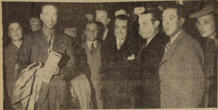
El celebrado actor argentino Tito Lusiardo, a su llegada a la Estación Maipo, procedente de Buenos Aires. Existe interés por la presentación que hará hoy en el escenario del Baquedano con su conjunto, ofreciendo un espectáculo alegre y novedoso.