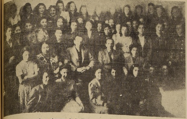
Profesorado y alumnas de la Universidad Popular Santiago.

Próximamente empezará a rodar varias cintas nacionales