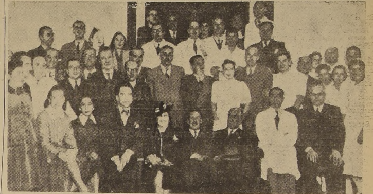
El Ministro de Salubridad, personal del Hospital y asistentes al acto de ayer.