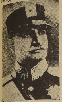
Riza Khan Pahlevi, ex Shah del Irán

DURBAN (Africa del Sur), 21 (U. P.).— Llegó a esta, proveniente de Mauricio, Riza Khan Pahlevi, ex Shah de Persia, quien seguirá viaje a América, después de una breve estadía en Natal.