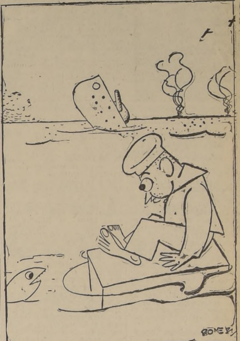
EL NAUFRAGO.—¿Quién fué el gracioso que dijo: "Dichoso aquel que tiene su casa a flote?"...