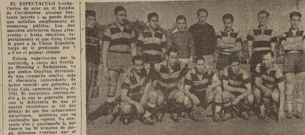
Conjunto del Badminton, vencedor del Santiago Morning por cuatro a uno. Derrotó a un adversario que no jugó como cuando ganó a Colo Colo.