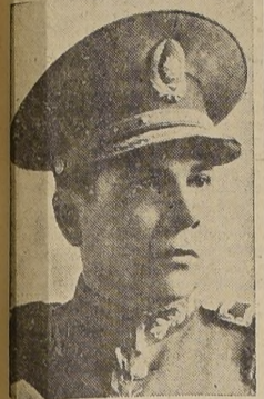
Excmo. señor Higinio Morínigo, Presidente de la República de Paraguay

Paraguay celebra hoy el 131.º Aniversario de su Independencia.