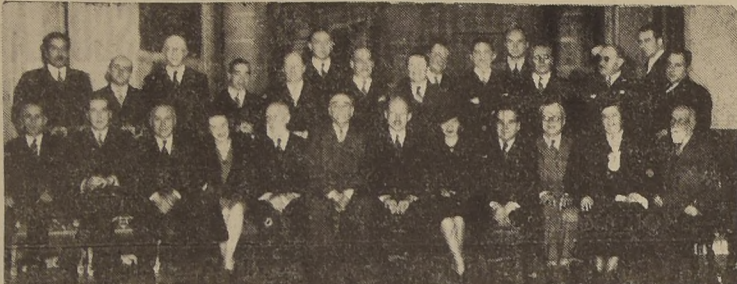
Asistentes al banquete en celebración del aniversario del Instituto de Ciencias Penales