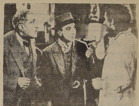
Una de las hilarantes escenas de la divertidísima película "Locos de Verano", animada por Enrique Serrano y Semillita...