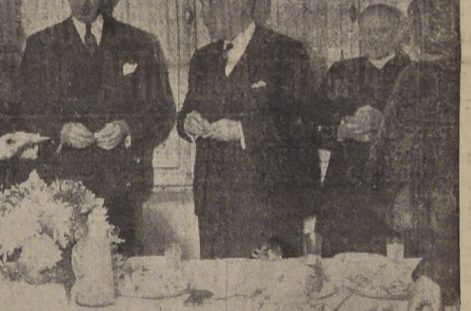
Durante la fiesta en el Casino de Oficiales

A la recepción ofrecida en la tarde en el Casino de la Oficialidad concurrieron S. E., Ministros de Estado, miembros del Cuerpo Diplomático y altos jefes del Ejército. — Concurso hípico en el P. Cousiño