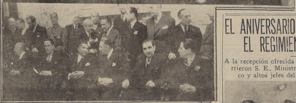
Diversos aspectos de la trascendental manifestación de ayer. — Arriba, S. E. entre el presidente de la Cámara y el vicepresidente del Senado. — Al centro, S. E. y el presidente del Senado, pronunciando sus discursos. — Abajo, un grupo de los asistentes.