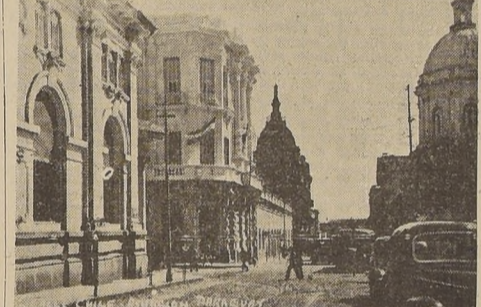
Calle Chile de Asunción

exclusivamente vermaculo recorriéndose a la fuente vivificante de la más pura paraguayidad. Somos partidarios de la democracia auténtica, pero no de su justificación. Nos repugna la mentira. Desearnos sinceramente perfeccionar y ampliar un contenido económico y social. La democracia exclusivamente electoralista en un pueblo no educado para el voto consciente y libre es una farsa. No asegura el gobierno del pueblo, sino el de los caudillos y demagogos, vale decir, el gobierno de los peores.