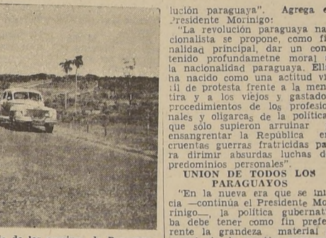
La fotografía muestra el buen pie de los caminos de Paraguay