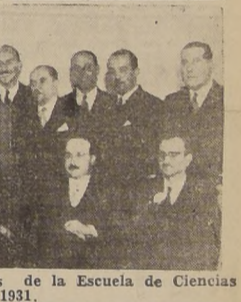
Asistentes a la manifestación efectuada anoche en el Hotel Carrera, entre los egresados de la Escuela de Ciencias Jurídicas y Sociales de la Universidad de Chile, del año 1931.