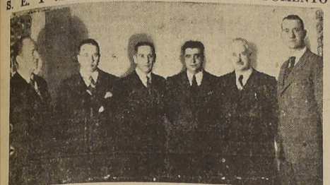
El Alcalde, regidores y vecinos de Rengo acompañados del diputado don Humberto Yáñez Velasco, durante su visita a LA NACION

COMISION DE VECINOS SE ENTREVISTO CON S. E. Y MINISTROS DE INTERIOR Y FOMENTO