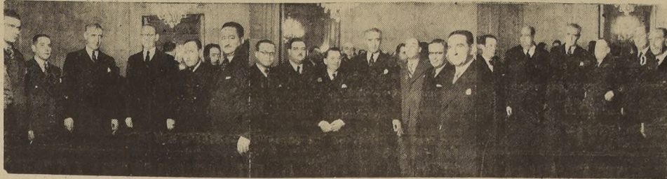
S. E. el Presidente de la República, Excmo. señor Juan Antonio Ríos, acompañado de algunos senadores y diputados de los diversos partidos, durante la recepción de ayer.

En la tarde de ayer se realizó en el salón de honor de la Presidencia de la República la recepción ofrecida por el Excmo. señor Juan Antonio Ríos a los parlamentarios, y que se desarrolló normalmente los segundos y cuartos lunes hábiles de cada mes, para estrechar los vínculos de los poderes Ejecutivo y Legislativo.