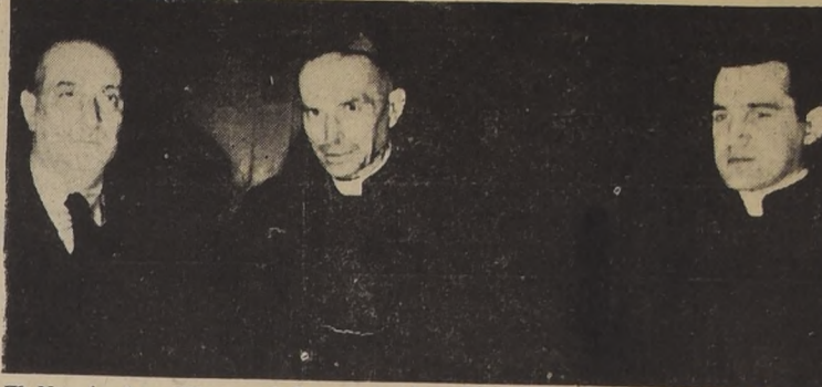
El Nuncio Apostólico y el Secretario de la Nunciatura, acompañados del Director de LA NACION