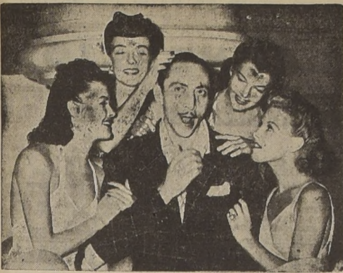
Aquí vemos a Mischa Auer rodeado de un grupo de preciosas chiquillas en la astracada del sello Universal 'LOQUIBAMBIA'...