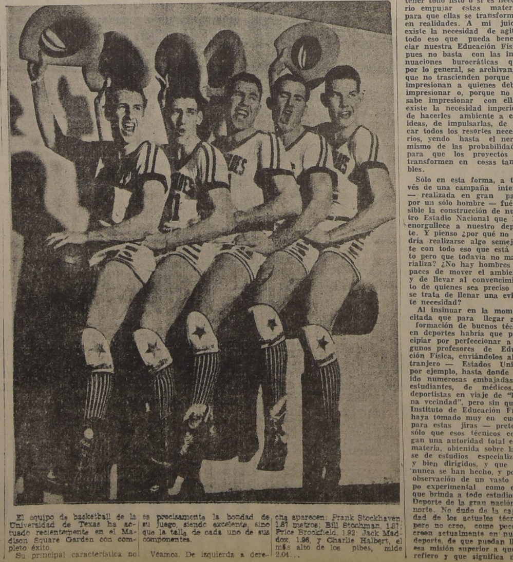
El equipo de basketball de la Universidad de Texas ha actuado recientemente en el Madison Square Garden con completo éxito.