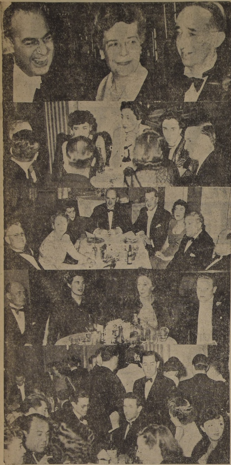
Con la asistencia del Excmo. señor Embajador de Estados Unidos, Mr. Claude Bowers, y señora, y nuestro Ministro de Relaciones Exteriores, don Ernesto Barros Jarpa, altas personalidades del comercio, banca, Ministros de Estado, Cuerpo Diplomático y de nuestra sociedad, se efectuó el gran baile en celebración del 166.º aniversario de Estados Unidos, en medio de gran alegría y entusiasmo, prolongándose hasta las primeras horas de la madrugada de ayer.