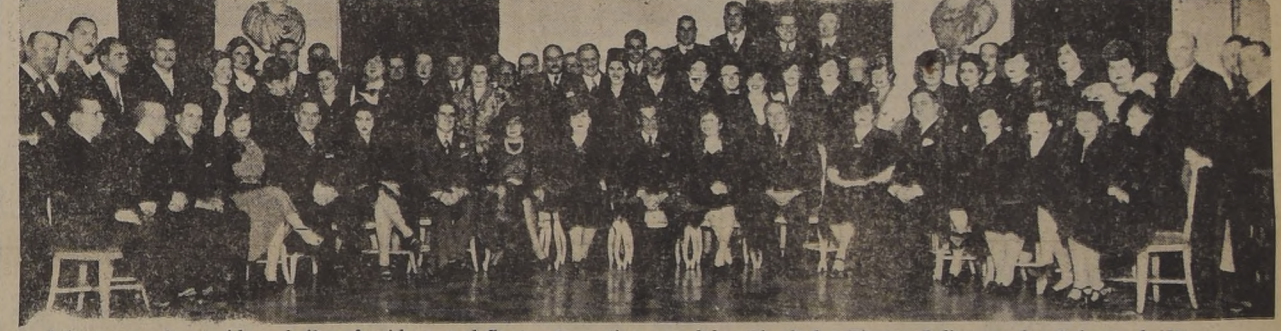
Asistentes a la comida y baile ofrecida por el Centro Argentino en celebración de las Fiestas Julias, en los Salones de Honor del Hotel Carrera.