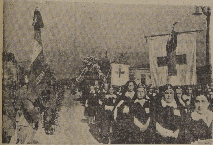
El cortejo en dirección al Cementerio General