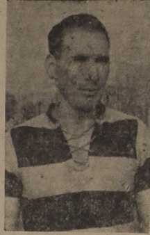
PIZARRO, crédito del Badminton