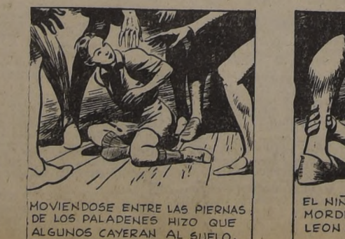
MOVIENDOSE ENTRE LAS PIERNAS DE LOS PALADENES HIZO QUE ALGUNOS CAYERAN AL SUELO.