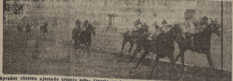
Speaker obtiene ajustado triunfo sobre Oporto en la carrera de fondo. Tercero Meteoro y cuarto Oldenburg.

brado por el gran favorito Oro Puro. En los comienzos de la faja Cherry Queen se desgració de Honorio que retrocedió batido, mientras Speaker comenzaba a descontar la ventaja que le llevaba el líder, empujándose a sacarle fuerzas de flaqueza a su pilotado, que en los últimos veinte metros emparejó la línea de Oporto y en el mismo disco lo derrotó por medio pesuczo. Tercero se clasificó Meteoro a dos cuerpos delante de Oldenburg, quinto, Kentucky, y último, Baquedano.