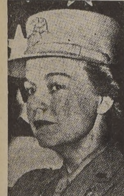
Oveta Culp Hobby, jefe del Ejército Auxiliar Femenino en formación