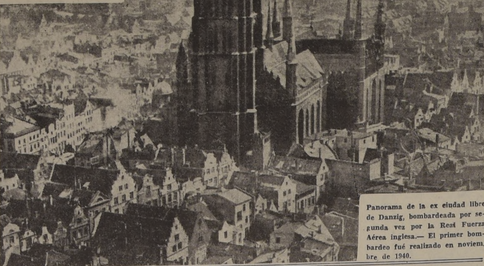
Panorama de la ex ciudad libre de Danzig, bombardeada por segunda vez por la Real Fuerza Aérea inglesa.— El primer bombardeo fué realizado en noviembre de 1940.