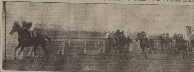
My Girl precede a Balacava, Chispa de Fuego y Bola Vista, en una de las pruebas condicionales sobre 1.200 metros

La puntera giró la curva y en la tierra decisiva galopó sin ver comprometidas sus posiciones en