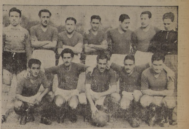
Conjunto del Audax Italiano, que ocupa mercedemente el primer puesto del campeonato profesional de football. Su match del domingo con Magallanes adquiere proporciones de gran interés.

Unión Española, en el otro encuentro oficial, se impuso al Green Cross por 3-0