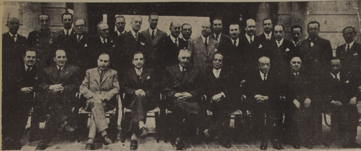
Asistentes al almuerzo ofrecido ayer por el directorio del Hipódromo Chile, a S. E. el Presidente de la República, don Juan Antonio Ríos. La presencia del Primer Mandatario en ese recinto, dió ocasión para que el público le tributara entusíastas manifestaciones de simpatía.