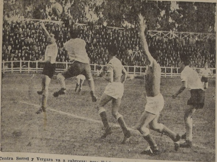
Centra Sorrel y Vergara va a cabecear; pero Ibañez advierte la jugada y sale a tiempo. La "U" tuvo una defensa magnífica, bien distribuida, y sin fallas.

Sin que se produjeran goals finalizó el encuentro oficial jugado ayer en el Estadio Militar