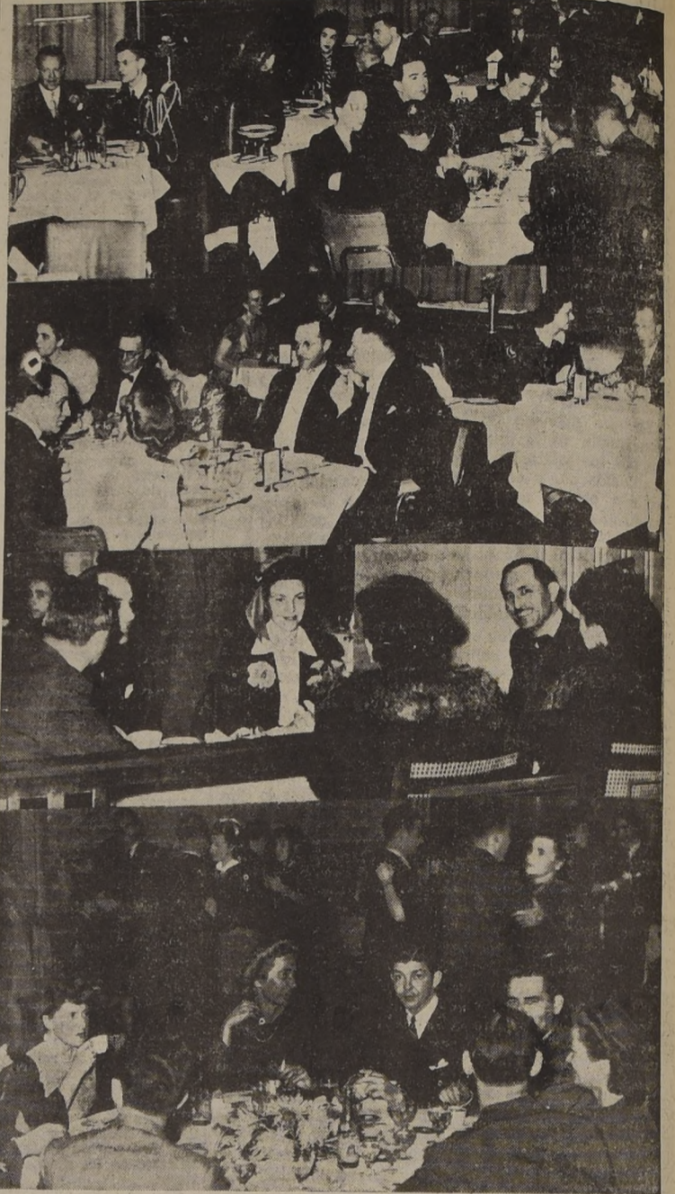
Diversos aspectos de los salones del Carrera que, como de costumbre, son visitados por un público selecto y distinguido que a diario disfruta de su agradable ambiente. Las fotos que publicamos corresponden al Roof-Garden, Grill-Room, Living, etc.

ARGOLLAS de oro garantidas macizas selladas y grabadas desde $ 98.00 el par. Entrega inmediata. CASA SOSTIN NUEVA YORK 66 No continúe