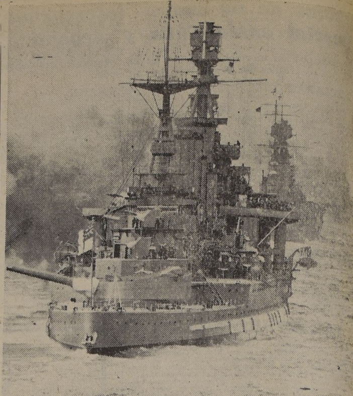
La flota inglesa, en combinación con la artillería y la Real Fuerza Aérea, bombardearon recientemente los objetivos enemigos en el puerto egipcio de Merut Matruh.

Al preguntársele su opinión respecto de los países sudamericanos neutrales y del resultado final de la guerra, el Ministro chileno afirma que Chile no es neutral, sino que es no beligerante, que es cosa distinta. Ante la agresión inculcable a Estados Unidos, diecinueve repúblicas americanas han declarado la guerra o roto las relaciones con el Eje, dos han seguido caminos diversos, pero respetando en todas sus partes los compromisos de solidaridad continental adoptados en las reuniones panamericanas. "En realidad, la divergencia es sólo aparente", dijo, "y mi Gobierno ha precedido a disolver toda agrupación política que pueda aparecer en pugna con nuestra posición ante el conflicto. Se mantiene estricta la vigilancia sobre las actividades