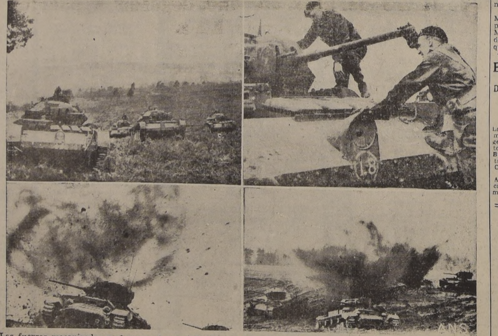
Las fuerzas mecanizadas y el personal especializado que los campos de Inglaterra antes de ser enviados a los frentes de guerra.— En el presente arreglo podemos observar diversas fases de esta concienzuda preparación, que se hace tan a lo vivo, que presenta casi todos los caracteres de una guerra real.