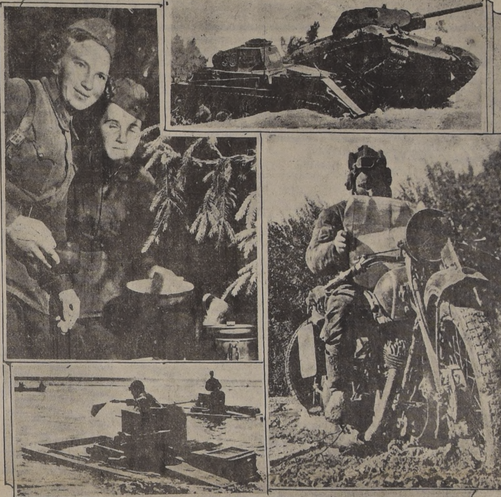
A arriba, a la izquierda, enfermeras del ejército ruso atendiendo una posta de primeros auxilios, establecida en un bosque. — A la derecha, choque de tanques producido durante el desarrollo de la campaña de Ucrania. — Abajo, a la izquierda, tanques anfibios empleados por los rusos para cruzar las zonas de los ríos Don y Donetz. — A la derecha, un correo motociclista del ejército ruso hace alto en el camino para consultar un mapa de la ruta.