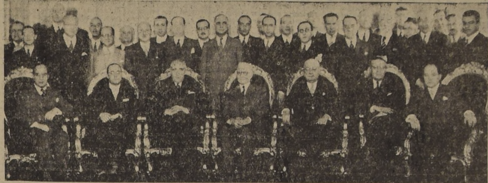
S. E. el Presidente de la República acompañado de los delegados a la primera reunión plenaria del Consejo Permanente de Asociaciones Americanas de Producción de Comercio, que lo visitaron ayer

A mediodía de ayer S. E. ofreció un cocktail en honor de los delegados extranjeros. — En la reunión plenaria de la tarde se trataron importantes materias