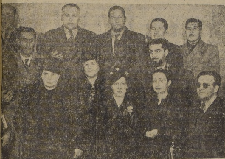
Dirigentes de la Unión de Profesores durante la visita que efectuaron ayer a LA NACION