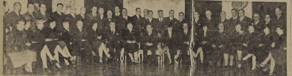
Comida ofrecida por los senadores y diputados radicales, en el Hotel Carrera, al Embajador de Chile en Rio de Janeiro...