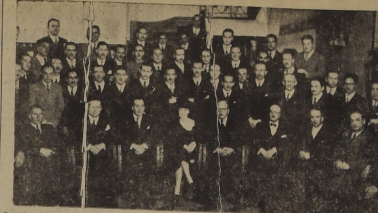
Comida ofrecida en el Savoy por los alumnos del sexto año de ingeniería de la Universidad de Chile...