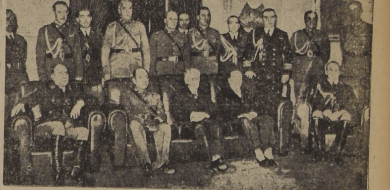
El Presidente de la República Argentina, el Ministro de Guerra, el Embajador de Chile y la Delegación Militar de Chile...