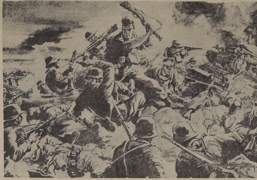
La lucha en el frente de Egipto se ha generalizado, registrando los británicos avances de importancia. Aquí vemos una escena común de las reacias batallas que libran los soldados del general Auchinleck contra las tropas nazis del general Rommel.

LA AVIACION ABRE EL CAMINO A LAS FUERZAS TERRESTRES Los bombarderos livianos de (PASA A LA PAG. 6)