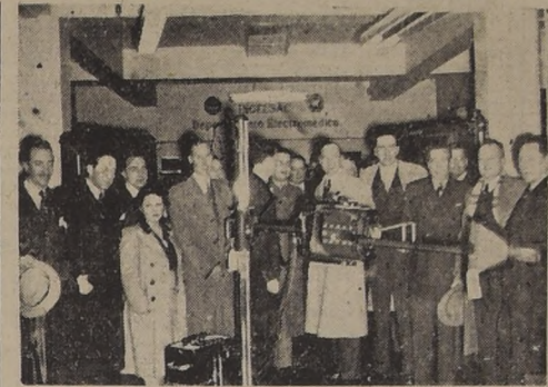
Autoridades y público asistentes al acto de ayer

EL MINISTRO DE SALUBRIDAD Cuando se había dado término al acto de inauguración del