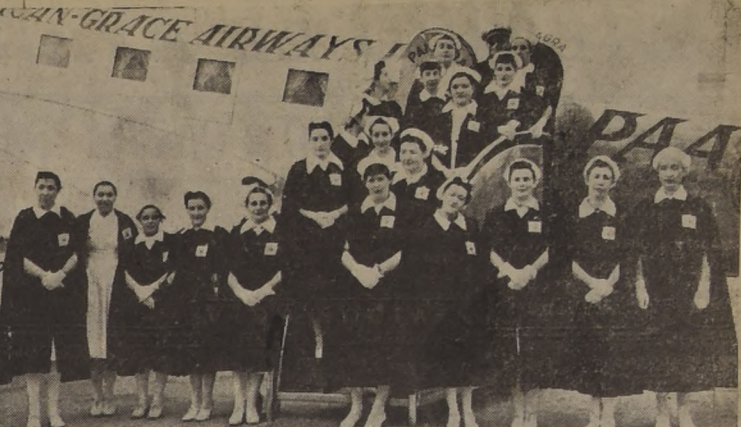
Grupo de 21 enfermeras de la Cruz Roja Chilena quienes efectuaron ayer un vuelo de familiarización en uno de los aviones de pasajeros de la Panagra. El vuelo duró aproximadamente una hora.

Radios PARA AUTOS RECIBEN LLEGADAS. SE OFRECEN. MORANDE 291 4º PISO OF. 62