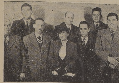
La Comisión de Vecinos que visitó ayer LA NACION

Una delegación de vecinos de Longavi se encuentra en esta capital gestionando ante los Poderes Públicos, la realización de un vasto plan de obras fiscales de suma necesidad para aquella importante comuna.