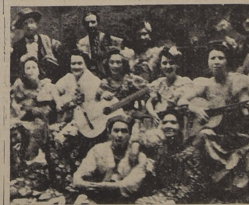
Parte del conjunto de guitarras que fué uno de los más aplaudidos números de arte de la velada de anoche de Extensión Cultural

Brillantes caracteres alcanzó la velada de arte realizada anoche en el Teatro Municipal por el Departamento de Extensión Cultural, que celebraba el décimo aniversario de su creación. El público asistente cubrió con exceso todas las localidades, calculándose en varios miles de personas. En esta ocasión, la Compañía de Extensión Cultural del Gobierno, Parlamento y la Administración Pública concurrieron al acto.