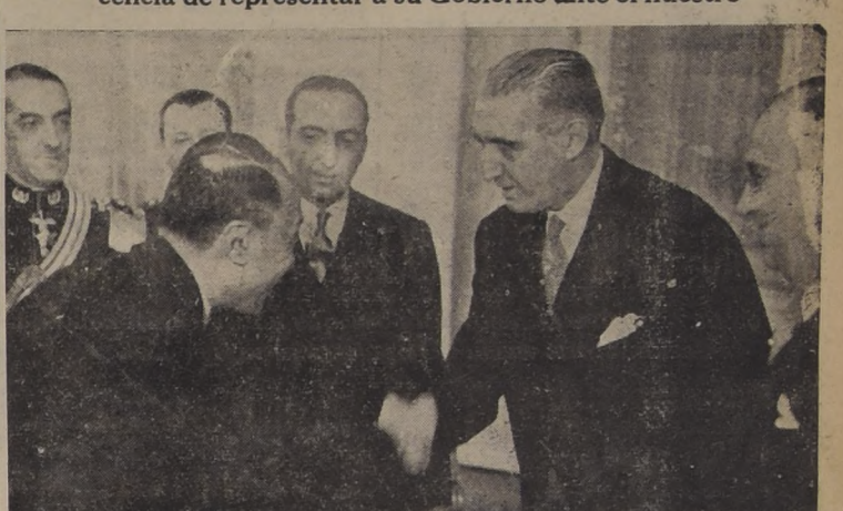
El Ministro de China saluda a S. E. en el acto de ayer.

El diplomático oriental expresó al Primer Mandatario su complacencia de representar a su Gobierno ante el nuestro