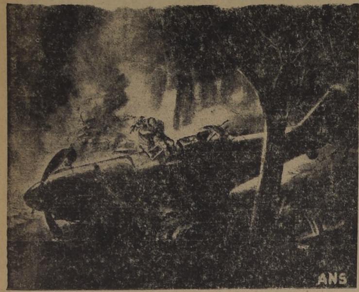
Un sargento de vuelo de la aviación británica salvó a su piloto del incendio del aparato, que se vio obligado a aterrizar al borde de un bosque. La máquina tocó los árboles y se incendió, quedando atrapado el piloto en la carlinga. El sargento, sin embargo consiguió escapar, y al intentar el salvamento de su compañero, advirtió que éste tenía un pie aprisionado por la barra del timón. Sin inmutarse por las llamas, al sargento subió a la carlinga, quitó la barra y arrastró al piloto lejos del alcance de las llamas. Luego recorrió la caja de primeros auxilios que estaba en el avión, y a fin de obtenerla, volvió al avión y penetró en él por la torre-ala de tiro.