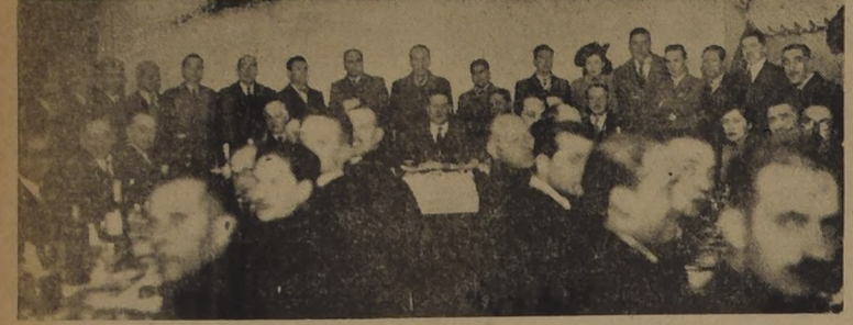
Una parte de los asistentes

Concurrieron el presidente del Partido Radical, el Director de los Servicios y varios parlamentarios. — Los discursos