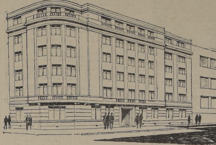
Dibujo en perspectiva, de las fachadas del edificio en el que es posible notar el soberbio aspecto que tendrá al terminarse las obras

El primero de ellos que tendrá acceso independiente, consistirá de vestíbulo de entrada, living-comedor, un dormitorio con dos closets, pieza de baño completa y kitchenette o pequeña cocina; el otro tendrá vestíbulo de entrada, living-comedor, dos closets, pieza de baño completa y cocina. Desde la entrada al edificio se llegará por intermedio de un suntuoso hall, a la escalera que sirve a todos