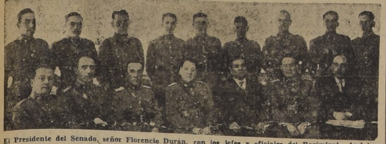
El Presidente del Senado, señor Florencio Durán, con los Jefes y oficiales del Regimiento Andalién

En un banquete de más de 200 cubiertos se reunió lo más representativo de las actividades sociales, políticas, militares, administrativas y económicas. — Visita al Regimiento Andalién