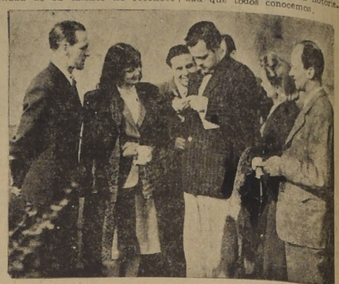
Orson Welles, a su llegada a Los Cerrillos

El nombre de "El ciudadano" ha dado la vuelta al mundo, arrojando resultados pecunarios que, después de las producciones de Chaplin no tienen precedentes en la historia de la cinematografía universal. De él se ha dicho, y con justicia, que es un elegido de los Dioses. En efecto, la versatilidad de su talento no reconoce límites. Es simultáneamente, productor, actor, director y argumentista. Maneja la cámara con la misma inteligente familiaridad que maneja la pluma y frente a los potentes reflectores del "set" sabe desenvolverse con un acierto de artista con una naturalidad inigualable. Como pudo el desconocido Orson Welles saltar al tapete de la actualidad y conquistar la vitalidad de los mejores artistas cinematográficos del mundo? La historia es aparentemente sencilla. Pero, para quien la escurridiza a fondo, ella misma, por sí sola constituye una sólida base para el argumento de una película. Canas de que nadie le llevara de apunte, escribió una audición que, con el nombre de "La Guerra de los Dos Mundos", causó furor, y hasta nos atreveríamos a decir, una malisima expectation entre el público norteamericano. En ello Orson Welles describe un cataclismo universal, lleno de situaciones curiosas y catastróficas que tenían como resultado la invasión de nuestro planeta por habitantes de otros mundos, con un concepto absolutamente des-tinto de las cosas y que exigía y constreñía a nuestro género humano a hacer las cosas más discretas e inverosímiles.