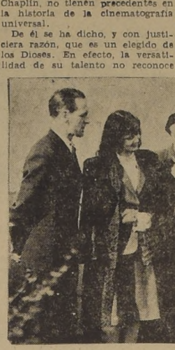
Orson Welles, a su llegada a Los Cerrillos

De veinticuatro años de edad su fisonomía trasunta nobleza de carácter y una gran inteligencia. De modales ágiles y desenvueltas de hablar parsimonioso y grave cualquiera es capaz de adivinar que tras su metro ochenta de estatura se esconde una personalidad impresionante y fuerte. Llegó ayer de Buenos Aires, y estuvo entre nosotros por dos días. Firmó autógrafos, efectuó vistas y en todas partes dejó el recuerdo de su sonrisa amable y de su limpieza sin amaramientos. Orson Welles, desconocido hace tres años, es en la actualidad el maravilloso resultado de un talento diestro y de una voluntad bien cultivada. El como tantos otros, vagabundaba por los "sets" de Hollywood a la expectativa de una oportunidad. Hasta que ésta se le presentó. Con la serenidad imperpetuable de quien sabe que tiene la razón, presentó a los productores de películas un argumento recto, humano y vivo. Los productores le miraron y movieron negativamente la cabeza. No; el argumento reflejaba energía, vivacidad, inteligencia, originalidad; pero, hasta cierto punto, era insoportable para el entendimiento de las masas, que al fin y al cabo constituyen la base de la prosperidad de todo negocio. Orson Welles insistió. Y finalmente realizó su película que con