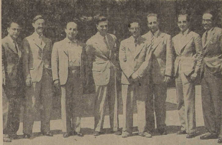
Latinoamericanos que estudian actualmente en Estados Unidos los métodos de electrificación rural...