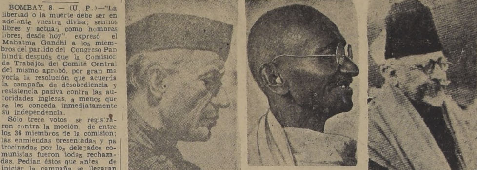
Nehru, Gandhi, Azad

Haría una visita al Virrey.— Partido del Congreso aprobó campaña de desobediencia y resistencia pasiva.— El Gobierno estudia medidas