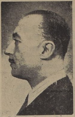
Embajador Luca de Tena

RIO DE JANEIRO, 8. (U. P.) — Por el avión de la Pan Air partió hoy para la República Dominicana, vía Trinidad, con el objeto de concurrir a la toma del Mando del nue-