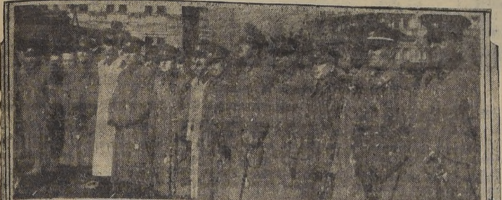
Durante el acto en el monumento a O'Higgins

Algunos de los principales actos fueron postergados. — Ofrenda floral al monumento a O'Higgins