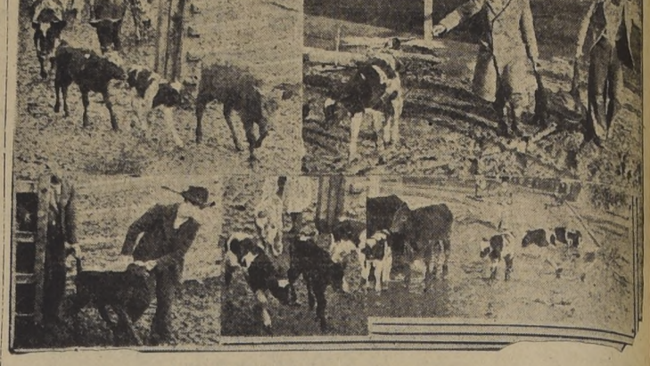
Durante la encierra de ganado menor

No se cumple con la ley que prohíbe sacrificar ganado menor en el Matadero Municipal