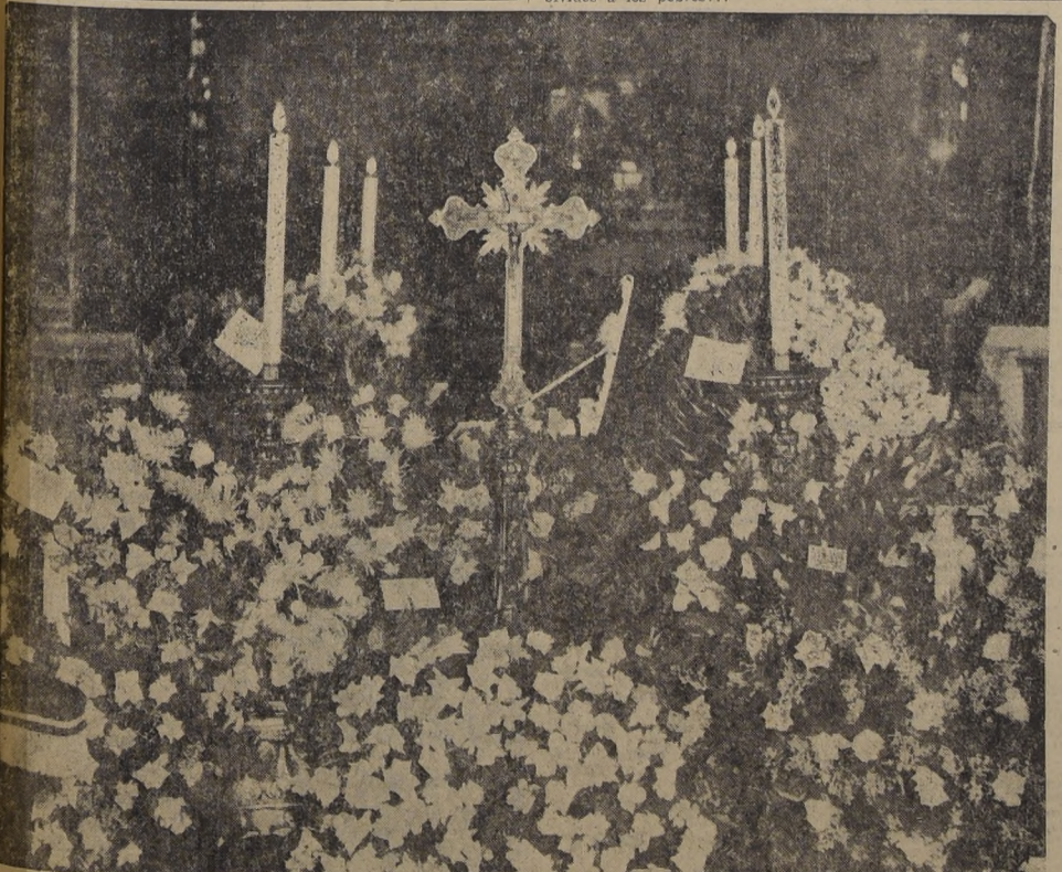
Capilla ardiente donde se velan los restos de la distinguida dama