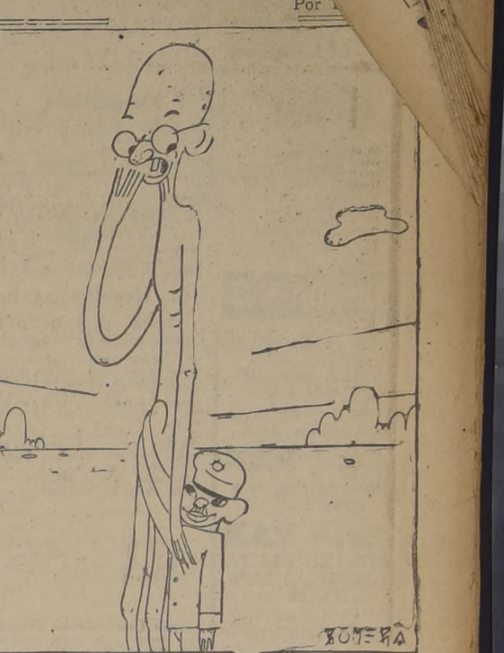
EL MAHATMA. — La verdad es que soy una "gandhisima" tapadera...