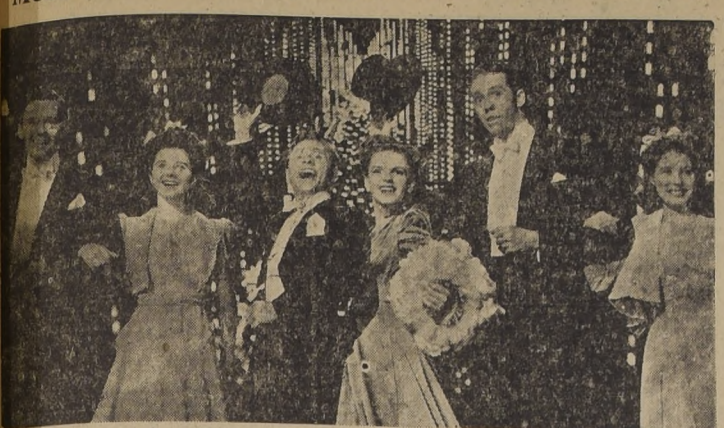
Mickey Rooney, Judy Garland, Virginia Weidler y Ray McDonald, aparecen en esta foto, en una escena de la producción "Música y Juventud" que el Metro estrenará en viernes.