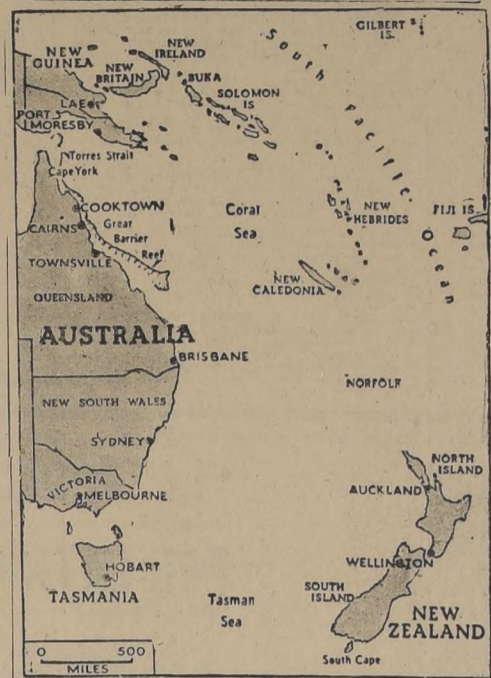
Mapa indicando la posición con respecto a Australia de las Islas Salomón, donde las fuerzas norteamericanas están ampliando el territorio reconquistado por sus fuerzas de desembarco.

El alto comando alemán anunció que un submarino nazi operando en el Mediterráneo Occidental, hundió al portaaviones británico "Eagle", que navegaba con un convoy fuertemente protegido. El "Eagle" (PASÁ A LA PAGINA 6)