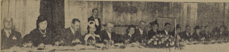
Mesa de honor en la fiesta anual celebrada por el Rotary Club en los salones del Crillon a la que asistieron delegaciones provinciales