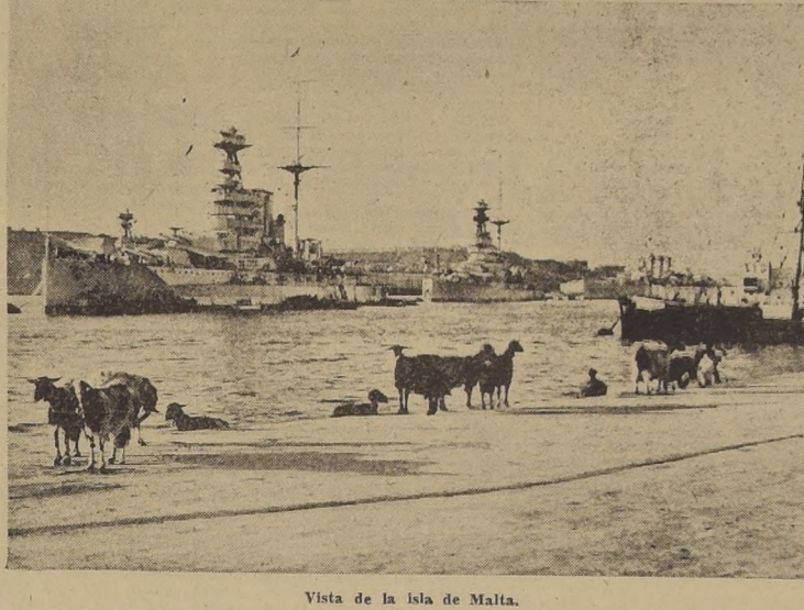
Vista de la isla de Malta.