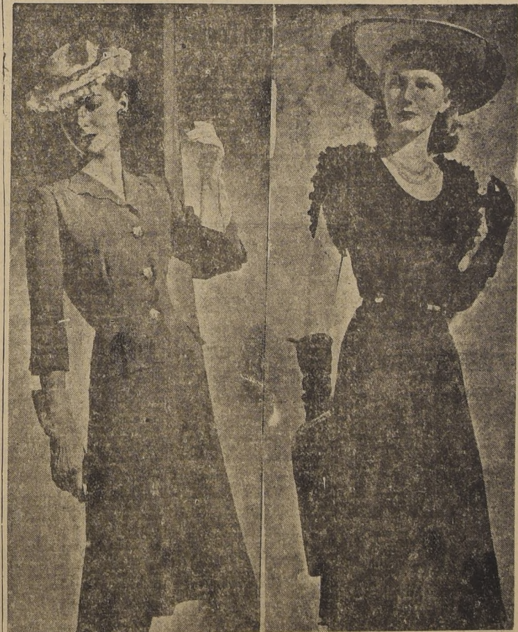
Trajecitos en dos piezas de lanilla delgada. La chaqueta lleva todos los bordes cortados en ondas. Vestidos en crepé rayón negro, adornado de vola dos angostos alrededor del escote y en las mangas. En tonos pastel o también, estampado resúta muy bonito este modelo