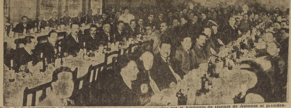
parte de la concurrencia al banquete ofrecido ayer en el Estadio Militar por el Sindicato de Dueños de Autobuses al presidente Nacional, diputado don Joaquín Mardones Bissig.