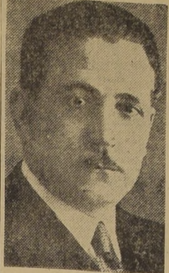
Excmo. señor Alfredo Baldomir, Presidente de Uruguay