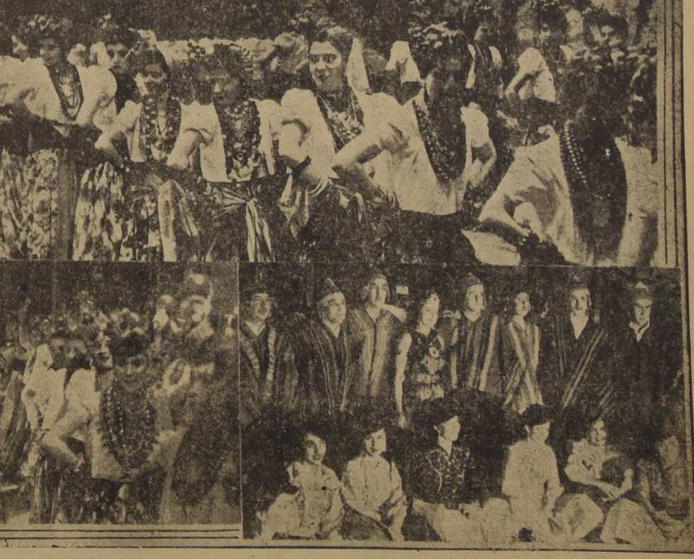
Algunos grupos de las señoritas y jóvenes que tomaron parte en la gran velada de gala que se realizó en el Teatro Municipal, a beneficio de la Universidad Popular "Juan Enrique Concha", y que a pedido de numerosas familias se repetirá el próximo sábado 29 del presente.

AHUMADA ESQ HUERFANOS ECOS DE LA FIESTA DEL MUNICIPAL..