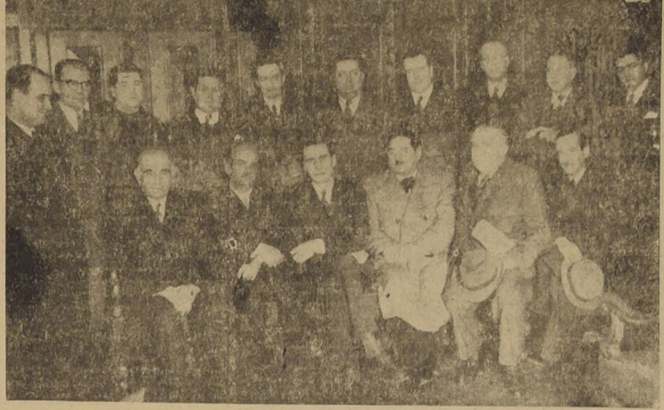
El Ministro del Interior, acompañado de los miembros de la comisión de celebración del bicentenario de Curico