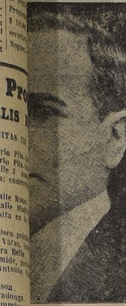
don Getulio Vargas, presidente de la República del Brasil, celebra hoy el aniversario de su independencia.