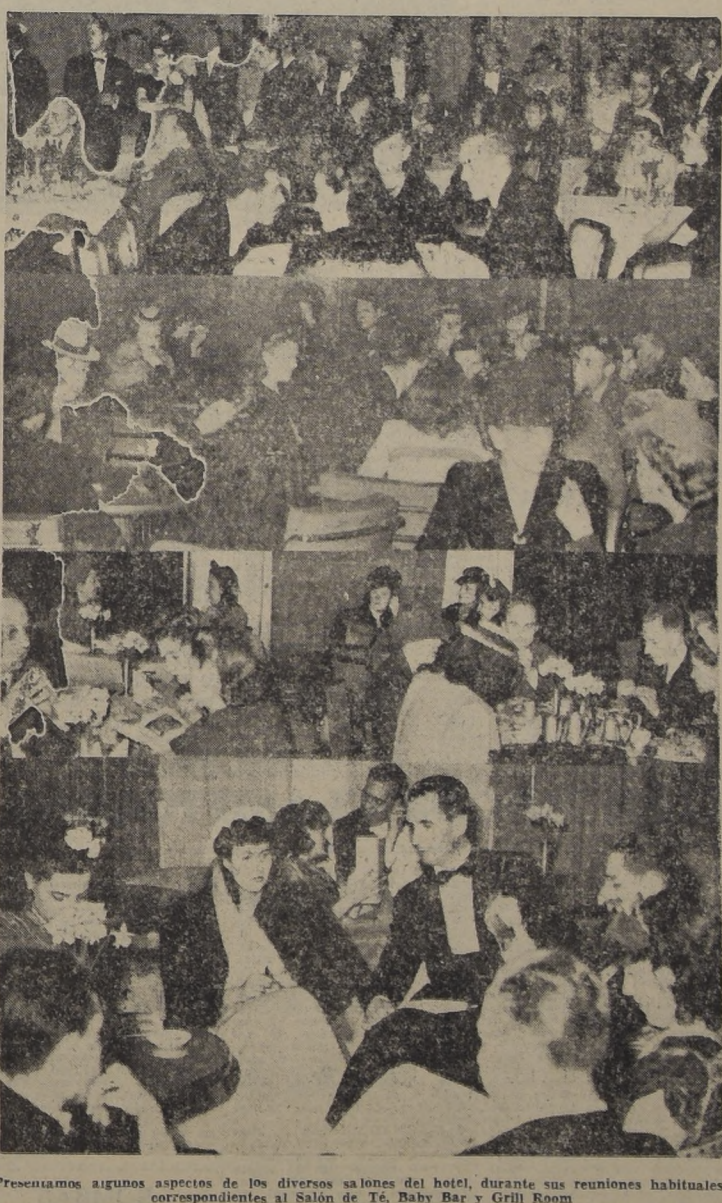
Presentamos algunos aspectos de los diversos salones del hotel, durante sus reuniones habituales, correspondientes al Salón de Té, Baby Bar y Grill Room