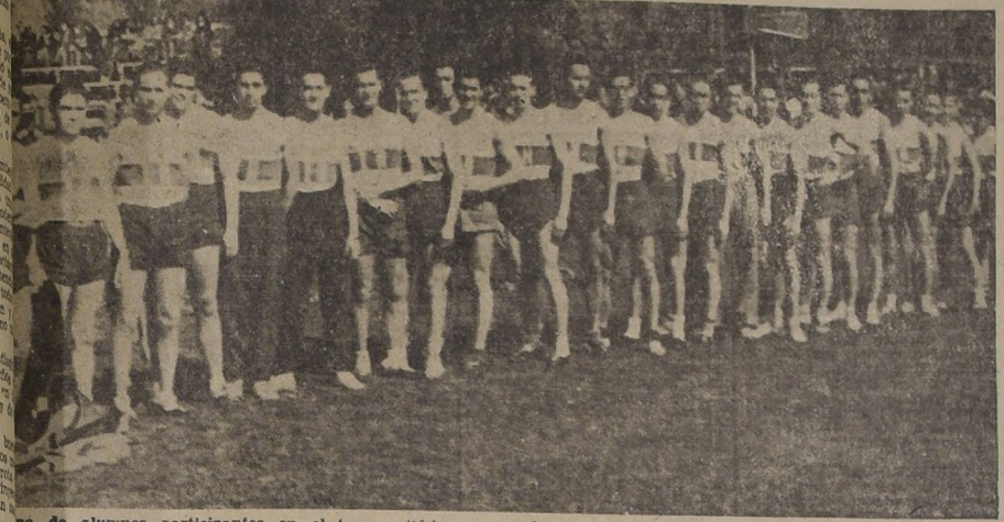
Boleto de alumnos participantes en el torneo atletico que se desarrollo ayer en la pista del Estadio Aleman