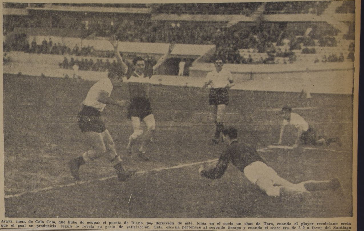
Araya meta de Colo Colo, que hubo de ocupar el puesto de Diano, por defeción de éste, toma en el suelo un shot de Toro, cuando el player recoletano creía que el goal se produciría, según lo revela su gesto de satisfacción. Esta escena pertenece al segundo tiempo y cuando el score era de 3-0 a favor del Santiago

Ya con el score de 2-0 a su favor, el dominio del Santiago fué haciéndose más notorio. Pero sin embargo, los blancos no decayeron y en varias oportunidades consiguieron efectuar