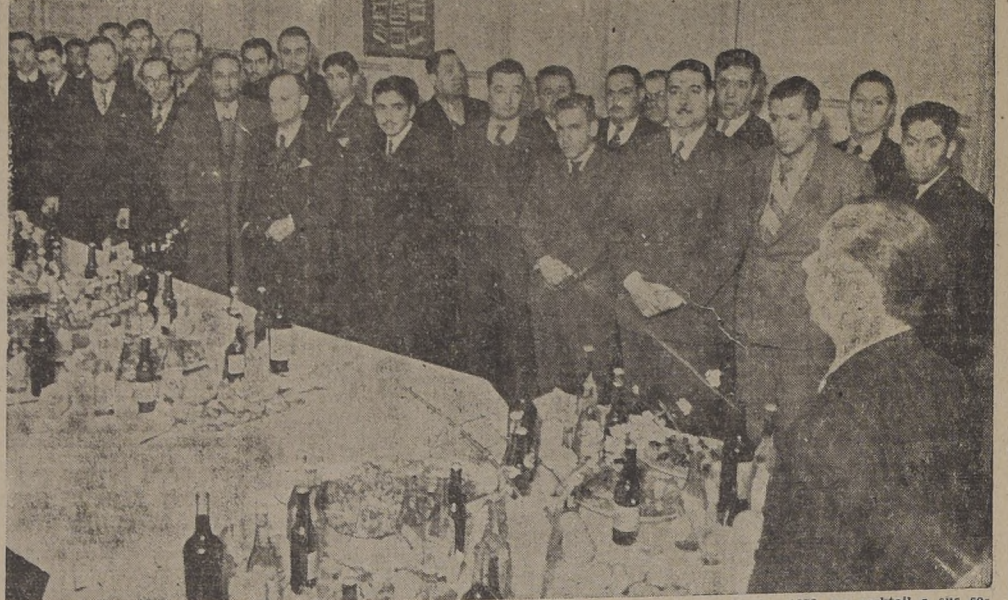
El Club Deportivo Magallanes ofreció en la tarde de ayer, en su sede de Avda. O'Higgins 1673, un cocktail a sus socios, simpatizantes, periodistas y jugadores del cuadro de honor...