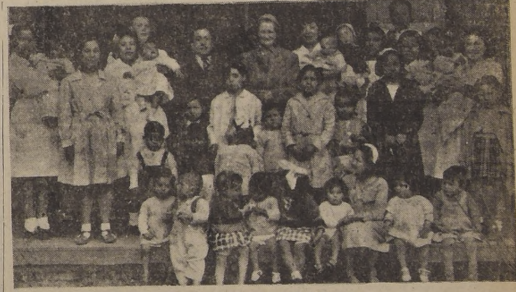
Un grupo de niños en el establecimiento