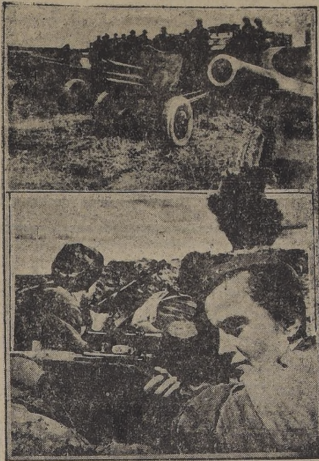
Arriba una batería de campaña del ejército ruso, esperando el orden de avanzar. — Abajo, zapadores cosacos, armados con fusiles automáticos, observan la explosión de un biocao enemigo en el frente de Stalingrado, y una guerrillera rusa que ha causado trescientas bajas al enemigo, con el rifle de mira telescópica que muestra el grabado.